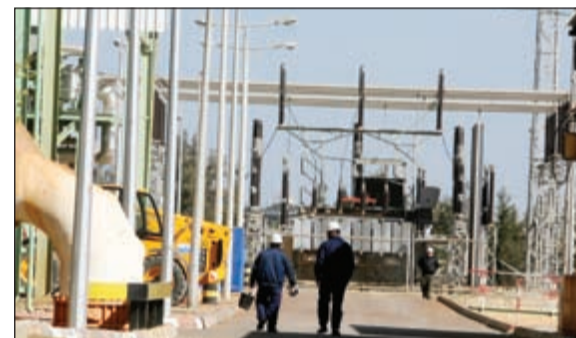
وزارة الكهرباء تسعى للحصول على خدمات شركات متخصصة لإدارة نظام العدادات الذكية

أن شركة الكهرباء السعودية قد استهلّت برنامجا لتطبيق نظام العدادات الذكية في مختلف أنحاء المملكة. ومن المعروف أن نظام العدادات الذكية يحتاج إلى شبكة سلكية أو لاسلكية تمكن من التواصل والبث الحي للمعلومات لدى المستهلك النهائي ونقلها إلى مركز السيطرة الرئيسي. وختتمت ميد بالقول إن النظام يتمثل في زيادة فعالية إدارة الطاقة، ويمكن لمثل هذا النظام أن يمكن المستهلكين من إجراء المزيد من المراقبة وترشيد استهلاكهم من الطاقة والمياه. في حين تستطيع الجهة التي تزود هذه الخدمة وضع تقديراتها واحتياجاتها وفقا لمعدلات الاستهلاك الفعلية، الأمر الذي يساعد على تقليص الخسائر إلى الحد الأدنى.