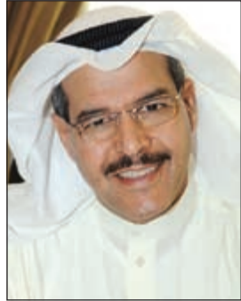
نائب رئيس مجلس الإدارة والرئيس التنفيذي أحمد الزين

ومن خلال شراء الطائرات مع عقود إيجار قائمة من شركات تأجير أخرى، هذا بالإضافة إلى أن الشركة ماضية قدما في تنفيذ الاتفاقيات التي تعاقبت بموجبها على شراء 117 طائرة جديدة من إيرباص وبوينغ يتم تسلمها في الفترة من 2017 حتى 2021. وتتكون محفظة الافكو حاليا من 53 طائرة مؤجرة على 16 شركة طيران في 13 دولة حول العالم. وتستهدف الشركة أن يكون لديها أسطول يزيد على 100 طائرة في نهاية العقد الحالي، سعيا من الافكو للمنافسة مع أكبر الشركات العالمية في مجال تأجير الطائرات. كما أن عدد الطائرات التي التزمت الافكو بشرائها