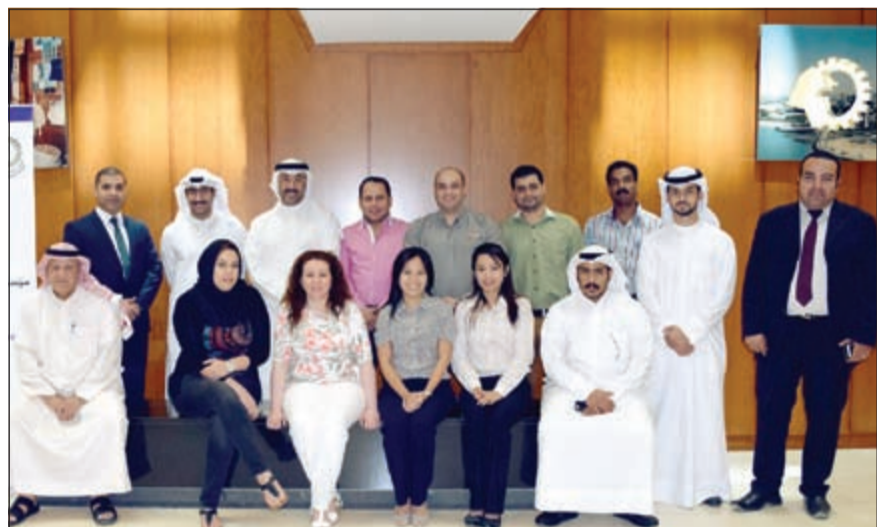
لقطة جماعية للمدربين

كما يتضمن محاور عن أخلاقيات المهنة والإدارة الاستراتيجية والتخطيط الاستراتيجي للوظائف والأنظمة المتطورة لتبادل المعلومات والقوانين المنظمة. وقد تم تنفيذه عن طريق شركة تانك للتدريب.