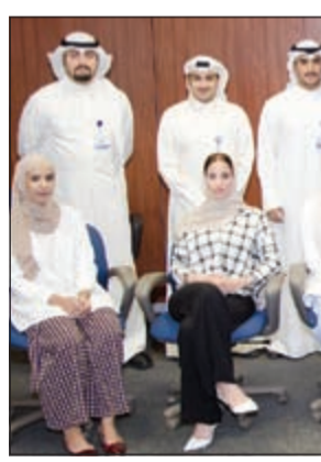
الموظفون المشاركون في البرنامج التدريبي

عقد بنك الكويت الدولي مجموعة من موظفيه المنضمين إلى أسرة الدولي حديثاً تدريبية في أساسيات العمل المصرفي الإسلامي ومنتجاته. وفي إشارة لهذه الدورة صرح المراقب الشرعي في بنك الكويت الدولي د.هشام عبدالحى أن هذه الدورة تناولت المراكز الأساسية والقواعد الحاكمة لأعمال والمعايير الشرعية لأبرز المنتجات والخدمات للمصرف الإسلامي.