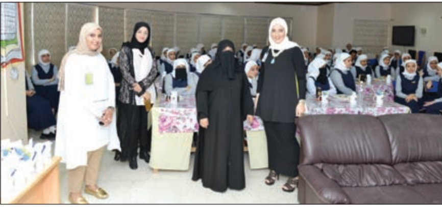
ممثلو بنك وربة خلال زيارتهم مدرسة درة الهاشمية