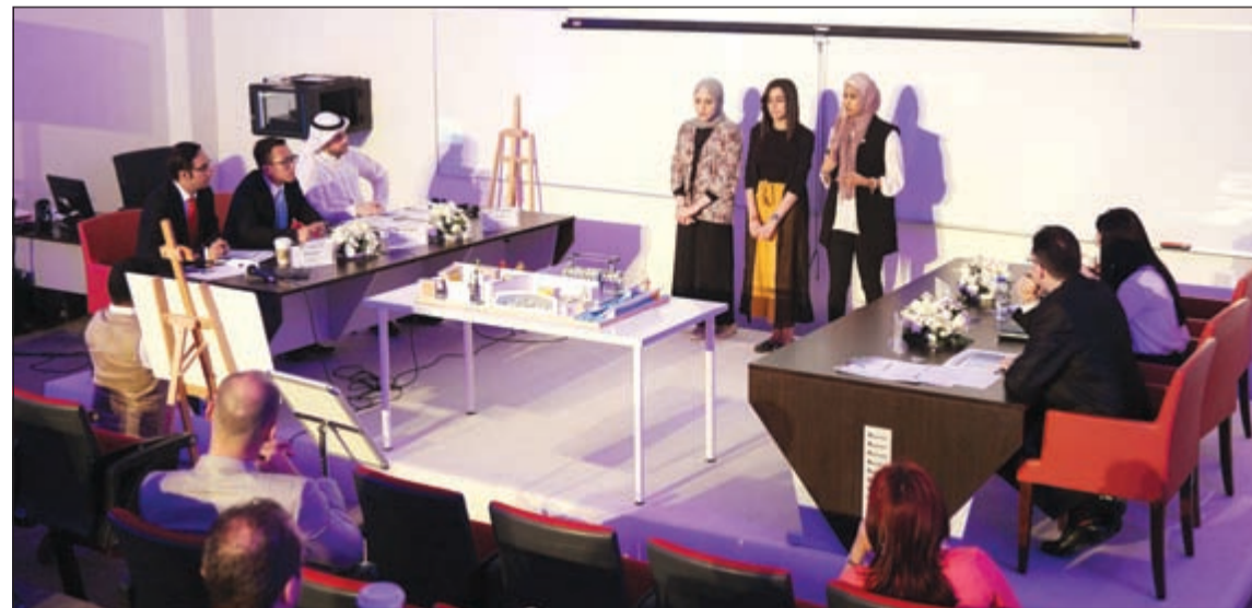
عدد من طالبات AUM يقدمون فكرة مشروعهن إلى لجنة التحكيم