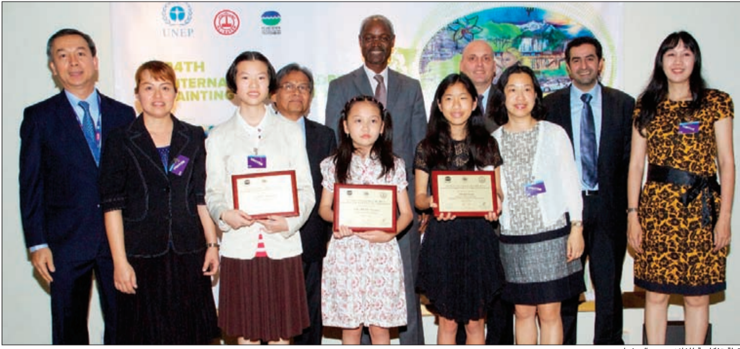
لقطة تذكارية للفائزين مع السفراء

اندونيسيا وستابورن فينيسيا من تايلند، وتم اختيار هذه الأعمال من ضمن ما يقارب 63,000 مشاركة من