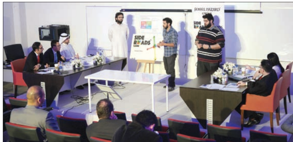
مجموعة من طلاب AUM يقدمون فكرة مشروعهم إلى لجنة التحكيم