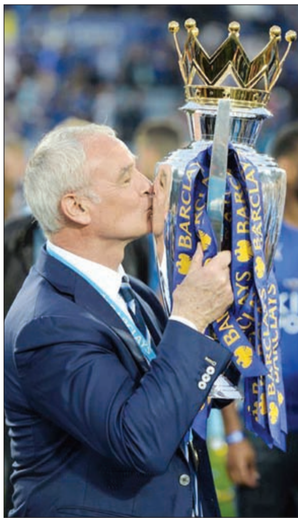
رائبيري وقبلة على الكأس العالمية

بريطانية «في نهاية الموسم ستنتحدث معه عن هذا الأمر (تمديد تعاقده رانيري)». وتابع «سنجلس معاً وعندما نتحدث عن شيء فأننا أعني أننا سنناقش عقداً طويل الأمد وليس فقط حتى سبتمبر. أحب أن يكون الناس الذين يعملون معنا سعداء ويستمتعون بوقتهم». وجدد اياوات وهو نجس للمباردين التايلاندي فيتشاي مالك نادي ليستر التزام النادي بالإبقاء على أفضل لاعبيه وتعزيز التشكيلة للموسم المقبل. ونارت تكهنت في الأيام الأخيرة عقب إنجاز الثعالب التاريخي أن لاعبين بارزين مثل رياض محرز ونجولو كانتي والهداف جيمي فاردي سينتقلون إلى أندية أكبر في إنجلترا وأوروبا. وقال اياوات «سنبدل كل ما في وسعنا لبناء الفريق وضمان استمرار هذه المجموعة المميزة من اللاعبين». واختتم: «سأناقش مع مكشفي اللاعبين القائمة التي سيرصونها وسأتحدث أيضاً مع رانيري لمعرفة رغباته بشأن اللاعبين. أساند هذا الأمر دائماً».