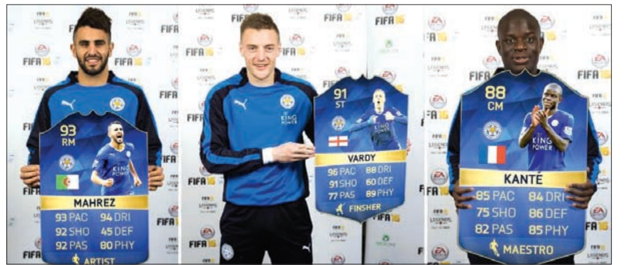
ثلاثي ليستر المربع