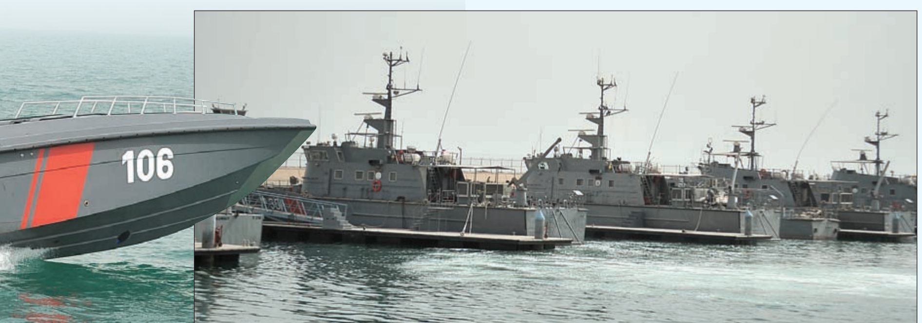
زوارق خفر السواحل على امبة الاستعداد لحماية مياطنا الإقليمية