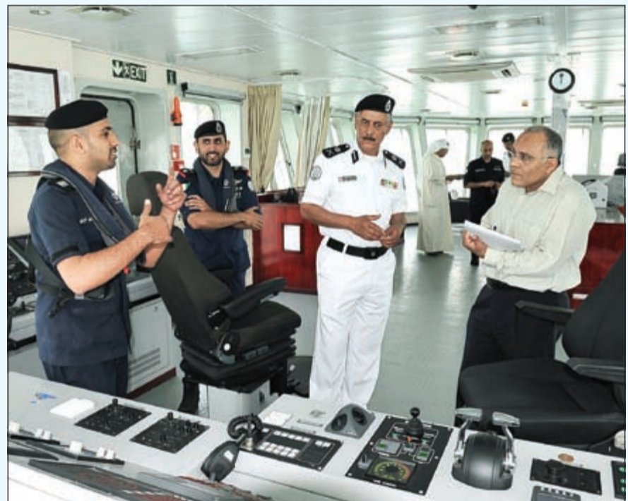
شرح حول طبيعة عمل أحدث قطعة بحرية دخلت إلى الخدمة والتي تعتبر نقطة ارتكاز ثابتة