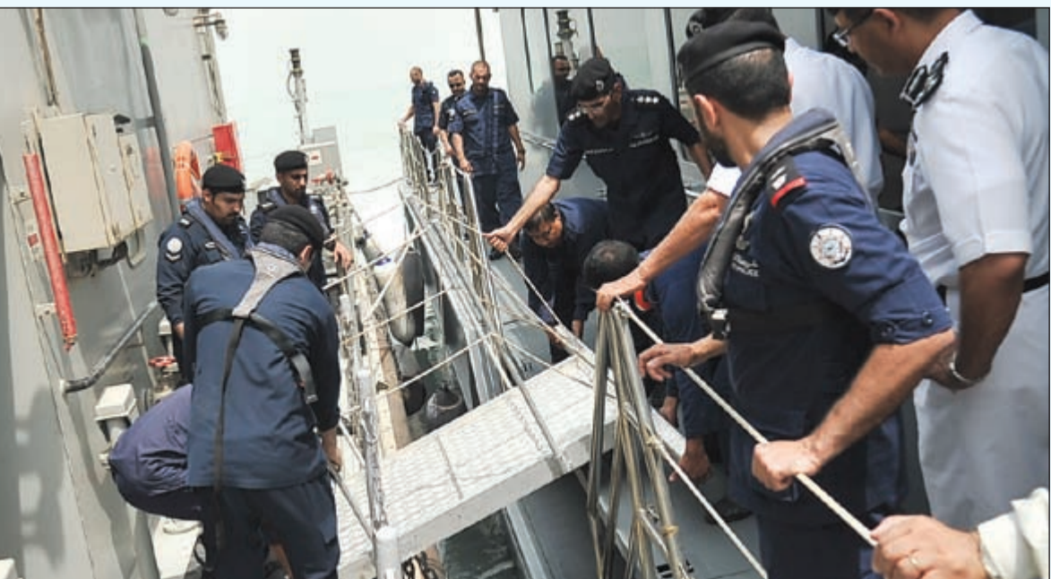
قوات خفر السواحل أثناء تنقلهم من زورق إلى زورق