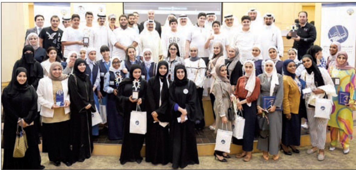
الطبة والطلبات الفائزون في صورة جماعية

تسجيل براءات اختراع للبيض منها، وهو الأمر الذي بث روح الإنجاز في نفوس الطلبة والطالبات المشاركين. وأكدت الشركة على إيمانها بتنمية المجتمعات وهو أمر بالغ الأهمية ومتصل بشكل كبير بنجاحها العام، وأن التعليم هو البوابة الرئيسية للتنمية في هذه المجتمعات، وفي ظل ذلك فإن الشركة أخذت على عاتقها دعم مجموعة من المبادرات التي تصب في هذا الاتجاه نظرا للسور الحيوي الذي يلعبه التعليم في النسيج الاجتماعي في الكويت.