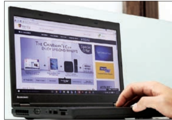
عروض فورية على مجموعات الإلكترونيات المتكاملة