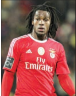
البافاري خطف المهيبة سانشيز

ضرب بايرن ميونيخ بطل ألمانيا مبكراً في سوق الانتقالات بتعاقد مع مدافعه السابق ماتس هوملز والنجم البرتغالي الصاعد ريناتو سانشيز كما أعلن النادي البافاري رسمياً أمس. وبات هوملز ثالث نجم من دورتموند ينتقل إلى صفوف بايرن ميونيخ في السنوات الأخيرة بعد ماريو غوتزه وروبرت ليفاندوفسكي عام 2013، والبولندي روبرت ليفاندوفسكي عام 2014. وذكرت تقارير في ألمانيا أن بايرن ميونيخ دفع مبلغاً قدره 38 مليون يورو للحصول على خدمات هوملز الذي ينتهي عقده مع دورتموند في يونيو عام 2017.