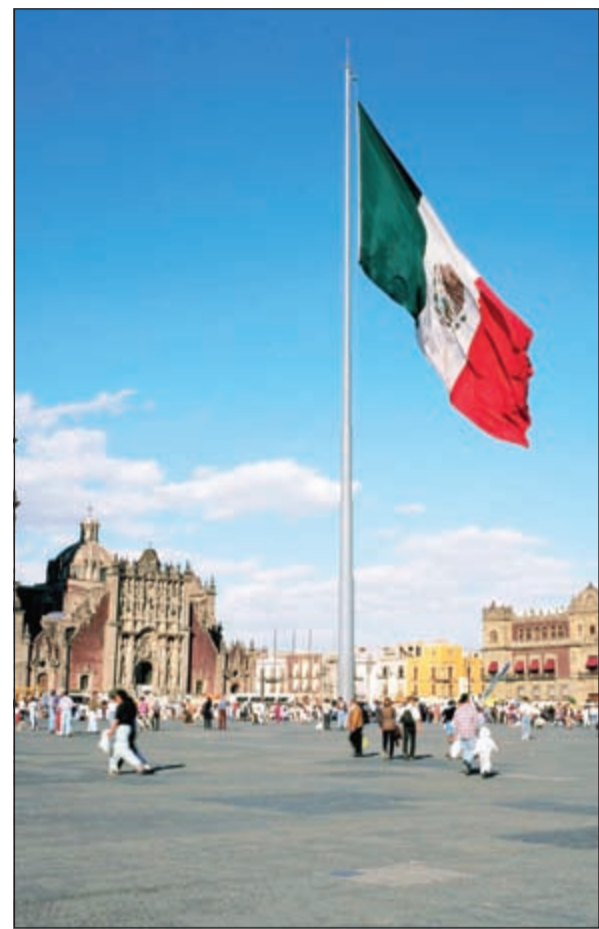
سنترينامكس في قلب مكسيكو

معا في الإتحاد الأوروبي لكرة القدم وأريد حقا أن احافظ على هذه الذكريات الإيجابية». بدوره، قال نيرسباخ عضو مجلس فيفا الجديد: «ميشال قام بعمل استثنائي في الإتحاد الأوروبي، لكن النهاية كانت حزية قراره بالاستقالة هو الأنسب ومنطقي حسب اعتقادي وأتمنى له التوفيق في المستقبل».