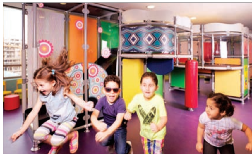
نادي الأطفال... مرح وترفيه

والفنون والحرف اليدوية والحصص الرياضية بالإضافة إلى الطبخ، مما يجعل قاعة اللعب متعددة الاستعمالات مكانا مناسبيا بما فيه من خيارات وعروض لا تنتهي. ويبدأ برنامجنا اليومي في نادي سيمفوني سنابل الكويت ابتداء من الساعة 9 صباحا وحتى الساعة 9 مساء، ويعتبر النادي وجهة مثالية للرحلات الميدانية لأطفال المدارس ورياض الأطفال بأسعار دخول رمزية لذا، لا تترددوا وسارعوا بزيارتنا لتقوموا بالنشاطات التي توفر لأحببة الصغار أجواء الأطفال الحيوية.