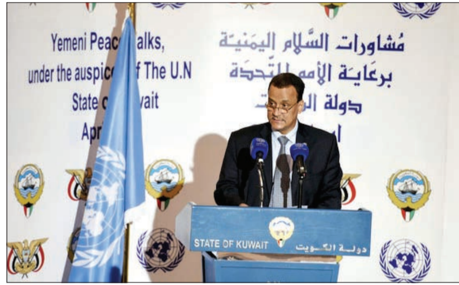
مبعوث الأمم المتحدة اسماعيل ولد الشيخ أحمد متحدثاً عن سير المفاوضات اليمنية

جميع المعتقلين والأسرى والمخطوفين. ولاتفاق، في الوقت الذي اختتمت اللجنة السياسية والعسكرية اجتماعاتها دون التوصل إلى أي اتفاقات.