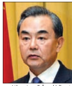
وزير الخارجية الصيني وانغ بي

وزير الخارجية الصيني يكتب لـ «الانباء»: «الحزام والطريق» وتعزيز علاقات التعاون الإستراتيجي الصينية - العربية والسفير وانغ دي: أفاق جديدة للتعاون الصيني - العربي