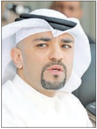
المستشار محمد راشد الدعيح

أصدرت محكمة الجنابات برئاسة المستشار محمد راشد الدعيح ووكيل المحكمة محمد القاضي عبدالعزيز المسعود حكماً بالسجن لمدة عام على عدد من المواطنين والمواطنات معظمهم من ربات البيوت، وتغريم كل منهم ألف دينار عما أسند إليهم من تهمة تقاضي رواتب دعم العمالة لمدة سنتين بغير وجه حق إثر تسجيلهم في شركة ثبت انهم لم يكونوا يعملون بها بشكل حقيقي. كما حكمت المحكمة بسجن صاحب الشركة التي سجلتهم ذات المدة والزام المتهمين برد الرواتب والعلاوات التي تقاضوها من دعم العمالة.