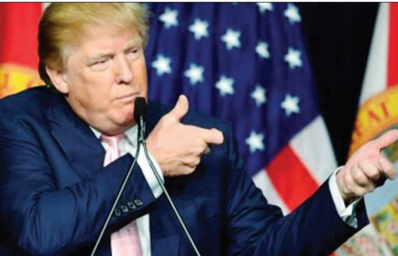
صورة أرشيفية للمرشح الجمهوري «المهرج» دونالد ترامب

واشنطن - وكالات: يشهد الحزب الجمهوري انقساماً كبيراً حول تأييد ترشيح دونالد ترامب في انتخابات الرئاسة الأميركية المقبلة، وذلك على نحو يهدد بإشغال حرب أهلية في صفوف الجمهوريين، بحسب شبكة «سي.ان.ان» الإخبارية. ويؤكد بعض القادة المحافظين في الحزب ضرورة وجود مرشح ثالث لتحدي ترامب وكلينتون. وفي هذا الإطار، حذرت صحيفة «واشنطن بوست» من أن ترشح ترامب سيدفع ببعض قادة حركة المحافظين - التي ينظر إليها على مدار أجيال على أنها العمود الفقري للحزب الجمهوري - إلى التحول من الحزب الذي يعاد تشكيله حالياً على نحو سريع بفضل لهجة ترامب المحرصة والعنصرية.