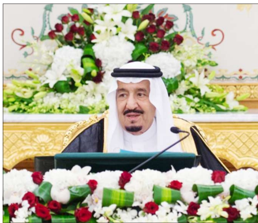
خادم الحرمين الشريفين الملك سلمان بن عبدالعزيز خلال ترؤسه جلسة مجلس الوزراء أمس (واس)

واختصاصاتها على أكمل وجه وبما يرتقي بمستوى الخدمات المقدمة للمواطن والمقيم وصولاً إلى مستقبل زاهر وتنمية شاملة. وأعرب الملك سلمان عن ترحيبه بالسوزراء الجدد وتمنياته بالتوفيق والسداد لهم وللمسؤولين الذين شملتهم الأوامر الملكية في مهامهم الجديدة، كما أعرب خادم الحرمين عن بالغ الشكر والتقدير للوزراء والمسؤولين السائقين على ما بذلوه من جهود مباركة. وأوضح وزير الثقافة والإعلام، د.عادل بن زيد الطريفي في بيان بثته وكالة الأنباء السعودية الرسمية «واس» عقب الجلسة أن مجلس الوزراء رفع الشكر والتقدير والعرفان لخادم الحرمين الشريفين على ما يوليه من حرص شديد على استمرار مسيرة التنمية والتطوير لهذه البلاد المباركة، مؤكداً أن صدور هذه الأوامر الملكية سيسهم