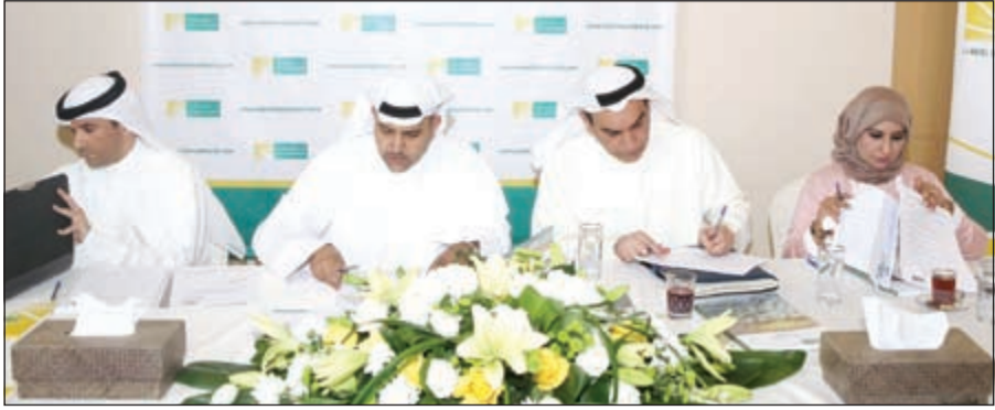
جانب من عمومية الشركة