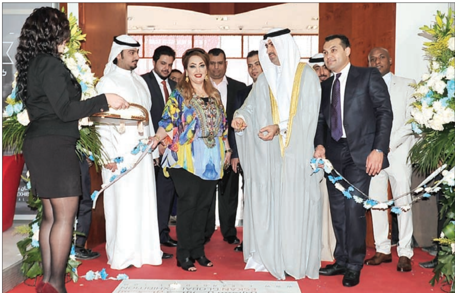
الشيخ نمر الصباح والشيخة فاطمة الصباح ومحمود عفيفي خلال قص شريط افتتاح معرض النخبة العقاري اسم