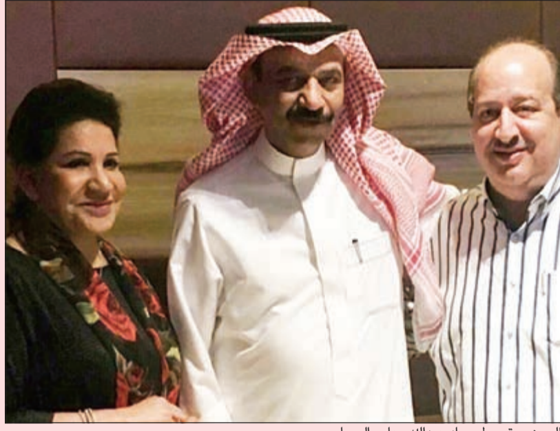
الجوهر يتوسط سعاد عبدالله وعامر الصباح

لتسجيل الأغنية قبل العودة إلى المملكة والاستعداد لتنفيذ عدد من المشاريع الفنية، وكان الجوهر قد وقع ويشكل رسمي مع منتج العمل عقد غناء المقدمة وسيتم تسجيلها في اليومين القادمين. الجدير بالذكر أن «ساق البامبو» هو عمل درامي تتمحور قصته حول شاب يدعى «عيسى» كتب عليه القدر أن يولد من دون هوية واضحة المعالم، فلم يرتكب جرماً في حياته، ولم يقترف أي ذنب، عدا أنه من أم فلسطينية وأب كويتي ويعاني الأمرين بسبب هذه المشكلة ومن المقرر أن يعرض المسلسل على قناة «الراي» في رمضان المقبل ويصور حالياً في مدينة دبي، بقيادة المخرج البحريني محمد القفاص، وبمشاركة كوكبة من نجوم الدراما الكويتية والخليجية منهم، بخلاف القديرة سعاد عبدالله، كل من شجون الهاجري وعبدالمحسن النمر وفاطمة الصفي وهند البلوشي وريم أرحمة وفرح الصراف والممثل الكوري «وان هو» وغيرهم من النجوم الشباب.