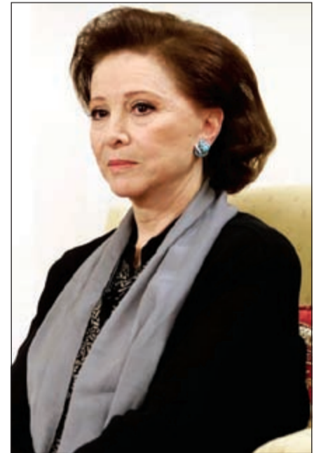
الفنانة الراحلة فاتن حمامة

في خطوة غير متوقعة، كشف المخرج المصري حسني صالح عن عزمه تحويل رواية عميد الأدب العربي الراحل طه حسين «دعاء الكروان» لمسلسل، من بطولة الفنانة زينة التي ستؤدي نفس دور «سيدة الشاشة العربية» الراحلة فاتن حمامة، بينما سيؤدي الفنان السوري تيم الحسن شخصية المهندس التي دشنت نجومية الراحل الكبير أحمد مظهر. يذكر أن فيلم «دعاء الكروان» احتل المرتبة