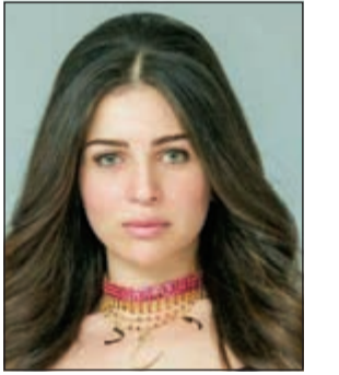
مي عز الدين

وجهدت النجمة المصرية مي عز الدين رسالة لجمهورها، على حسابها بـ «انستغرام»، طالبتهم فيها بوقف هجومهم الشرس على أي شخص يهاجمها. وقالت مي في رسالتها: «يا أغلى الناس عندي وأجمل فنان في الدنيا.. علشان خاطري متجومش حد هجوم شرس كده.. أنا شوفت حاجة النهاردة تجاه حد كان صديق عزيز عليا جدا من وأنا صغيرة، حتى لو كان قال رأي عني بأسلوب جارح أنا نفسي ميزعلش لأن اللي بيشتغل مهنتي دي