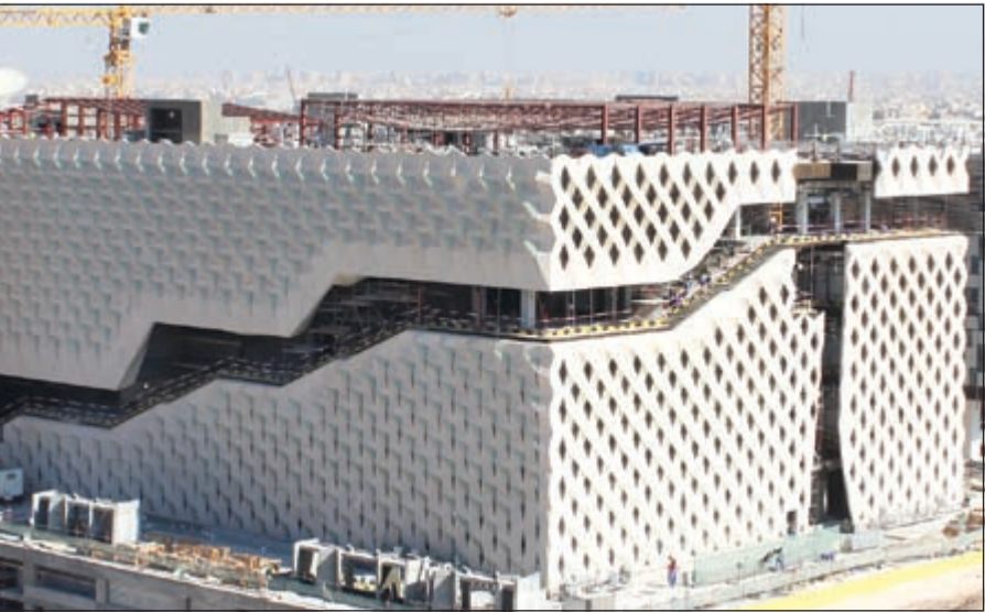
جانب من الأعمال الإنشائية