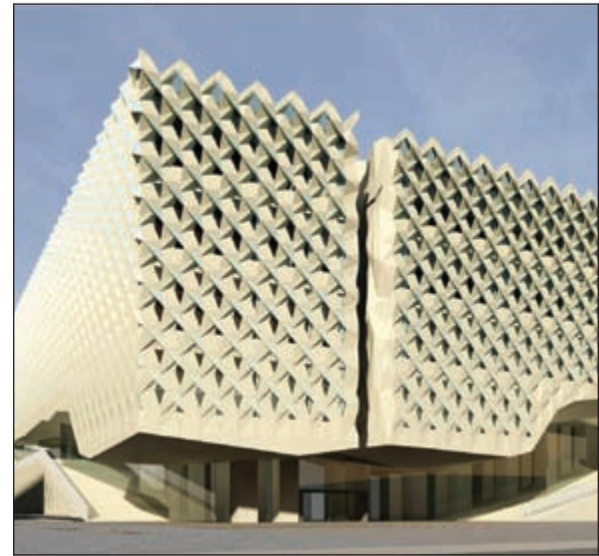
مشروع مبنى كلية التربية