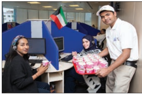
عملاء وموظفو البنك خلال حملة الصيف بالتعاون مع باسكن روبنز