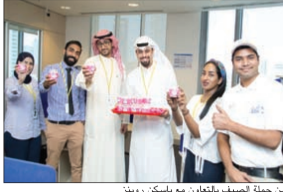
من حملة الصيف بالتعاون مع باسكن روبنز

وقد قام موظفو باسكن روبنز بتقديم أطيب أنواع الآيس كريم مجاناً لكافة عملاء وموظفي البنك للاستمتاع بالتحفكات اللذيذة المتميزة. وقد غطت هذه الحملة جميع فروع البنك الأهلي الكويتي والبالغ عددها 31 فرعاً منتشرة في كافة مناطق الكويت. ولعرفة المزيد من المعلومات عن البنك الأهلي الكويتي الرجاء زيارة موقعنا على www.eahli.com أو الاتصال بالخدمة الهاتفية «أهلا أهلي» على 899 899 1.