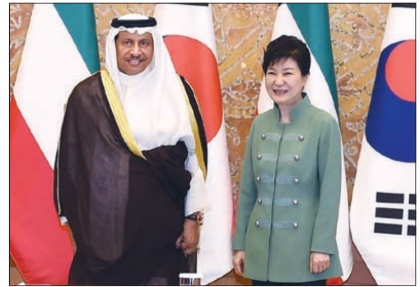
سمو رئيس الوزراء الشيخ جابر المبارك ورئيسة كوريا الجنوبية بارك كيون هيه

المبارك سلم رسالة خطية من الأمير إلى رئيسة كوريا الجنوبية وعقد ونظيره الكوري جلسة مباحثات رسمية