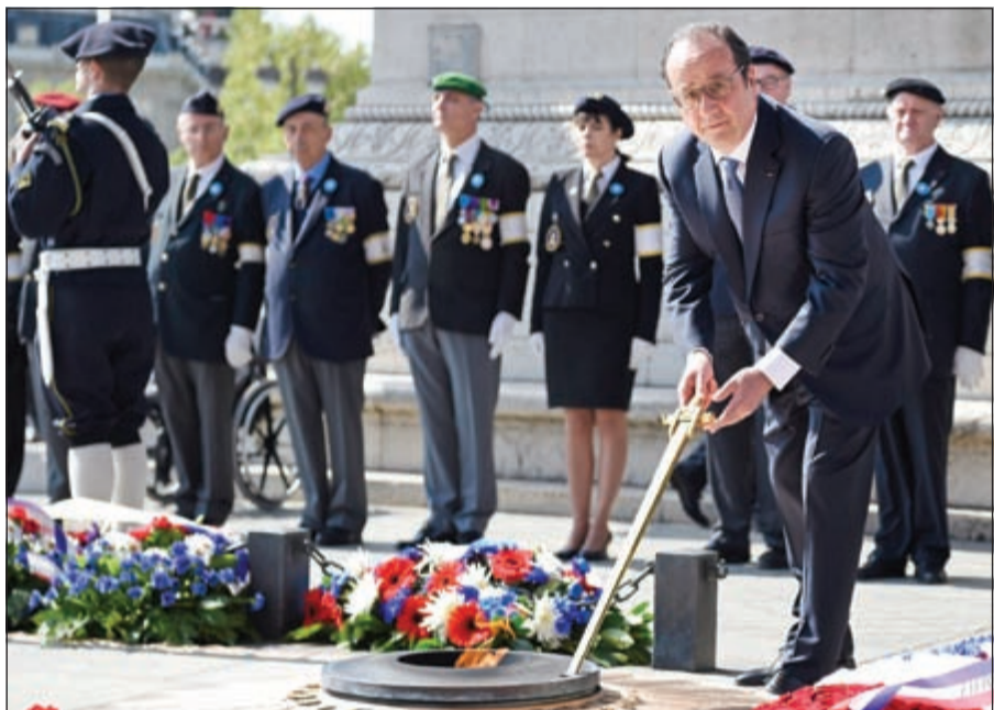
هولاند يوقد شعلة الجندي المجهول بقوس النصر في ذكرى انتصار 8 مايو 1945

باريس - أ.ش.أ: ترأس الرئيس الفرنسي فرانسوا هولاند أمس الاحتفالات المقامة في البلاد بمناسبة الذكرى الـ 71 لانتصارات الثامن من مايو 1945 والتي توافقت ذكرى نهاية الحرب العالمية الثانية. وبدأت المراسم الوطنية الفرنسية بوصول الرئيس هولاند، وسط تدابير أمنية مشددة، إلى جادة الشانزليزيه حيث وضع إكليلاً من الزهور بساحة «كليمنصو» على تمثال الزعيم الراحل مؤسس الجمهورية الفرنسية الخامسة «شارل ديغول» ثم أوقد شعلة الجندي المجهول بقوس النصر ووضع إكليلاً من الزهور على قبره برفقة رئيس الوزراء مانويل فالس وأعضاء الحكومة ومن بينهم وزير الدفاع جون إيف لورديان. وصاح عدداً من قدامى المحاربين وكبار العسكريين الفرنسيين، مستعرضاً حرس الشرف