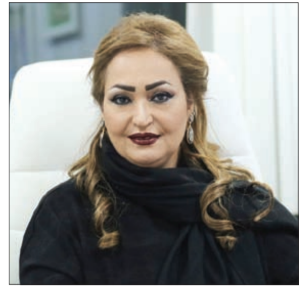
الشيخة فاطمة الصباح

بهذه المناسبة قالت الشيخة فاطمة الحمود الصباح رئيس مجلس إدارة المجموعة: تطلق اليوم دورة جديدة من دورات معرض النخبة العقاري على أرض المعارض الدولية بمشرف بمشاركة موسعة من شركات ومؤسسات عقارية تطرح مشاريع وفرص استثمارية مميزة داخل وخارج الكويت.