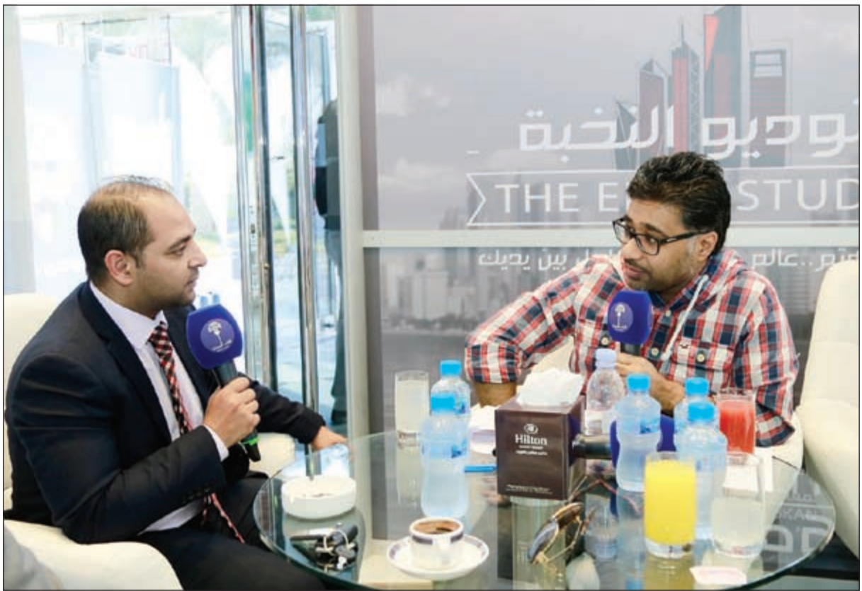
تغطيات إعلامية وفعاليات متنوعة تتميز بها معارض النخبة