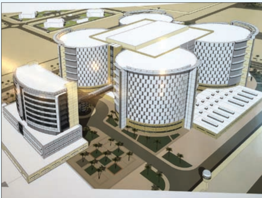
نموذج للسجن المركزي الجديد والمصمم بطراز فندي

● بالطبع لا يمكن تعميم العودة على السلك، فهناك الكثير ممن دخلوا السجن أن لم تكن أغلبيتهم يندمون