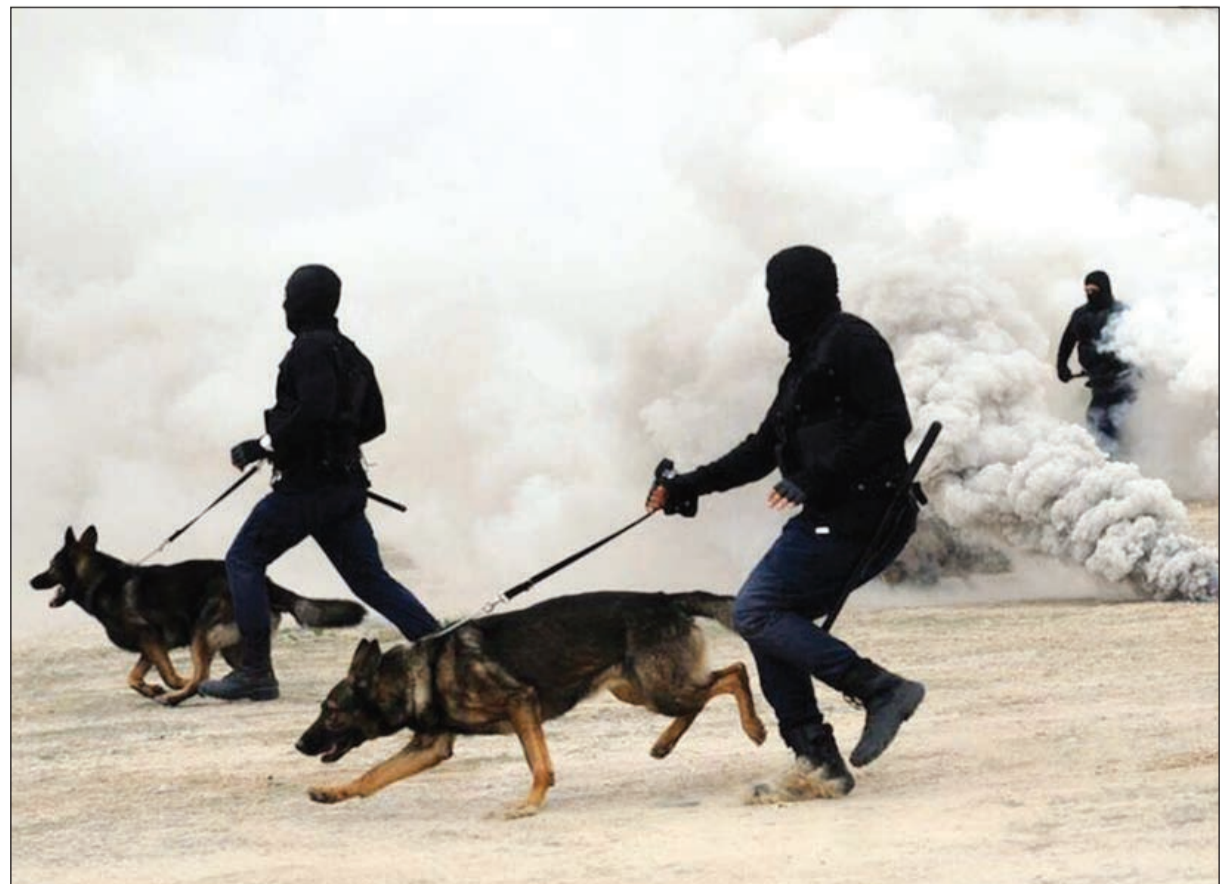
تدريب الكلاب البوليسية على مهام الاقتحام والتعامل مع الشغب

● قال العقيد الكندري: نحن نتعامل مع السجناء بما يسمح به القانون وبما تملبه علينا ضمائرنا، وبالتالي لا يسمح بإطلاق الكلاب البوليسية للبحث عن الممنوعات في المواد الغذائية، وإنما تتبع أسلوب التفتيش الذاتي.