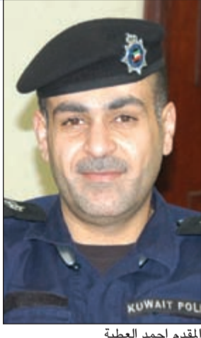
المقدم احمد العطية