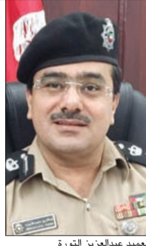
العقيد نايف الكندري

العقيد الكندري: تراقب السجن عبر كاميرات متقدمة المقدم العطية: نوابك حيل المهريين بمزيد من العمل المقدم القلاف: تأهيل الكلاب البوليسية للكشف عن المخدرات الرائد الجيمان: الانتهاء من 4 دورات تأسيسية