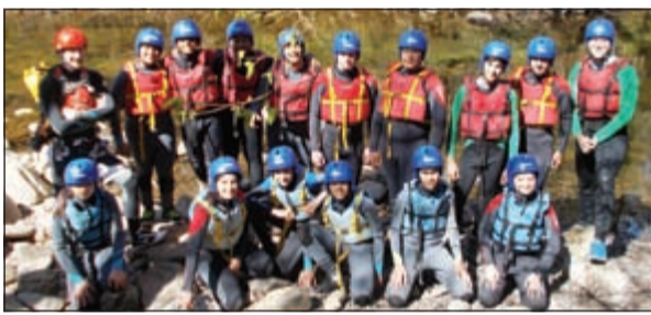
الفريق المشارك في الرحلة في لقطة تنكارية

نظمت المدرسة البريطانية بالكويت في عطلة الربيع رحلة ميدانية إلى الغابات الوطنية «بريكون بيكونز» في ويلز بالمملكة المتحدة، لطلاب قسم الجغرافيا من صفوف الثامن والتاسع والعاشر. وقد تمكن الطلاب من التعرف على مهارات عمل الكشافية عند نهر تارا، وجمع المعلومات من مراحلها الأولية مثل مستوى سرعة المياه العمق ورتوية الأرض واختلافات استدارة الحصى المتواجد على ضفتي النهر، كما قام الطلاب بعمل اختبارات بيئية وتجارب عملية ونظرة ومسح جيولوجي عند مصب النهر. وفي نهاية الرحلة استمتع الطلاب بالسير على الأقدام عبر المضيق والتجديف في نهر «واي» وركوب الطوافة كما تسلقوا على أعلى جبل في جنوب المملكة المتحدة «بن واي فان» الذي يبلغ ارتفاعه 2907 قدم، وذلك بمساعدة فريق مغامر، وكانت تجربة رائعة لكل من الطلاب، ومعلميهم المرافقين في ربوع الطبيعة الخلابة في ويلز.