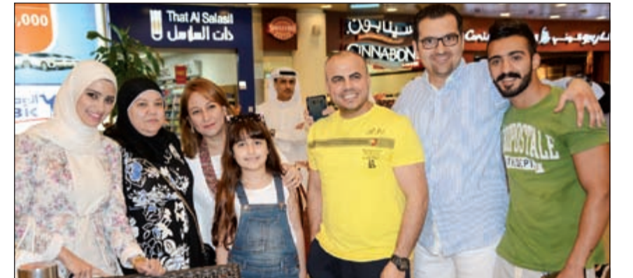
أعضاء اللجنة الاجتماعية باستقبال الزوار