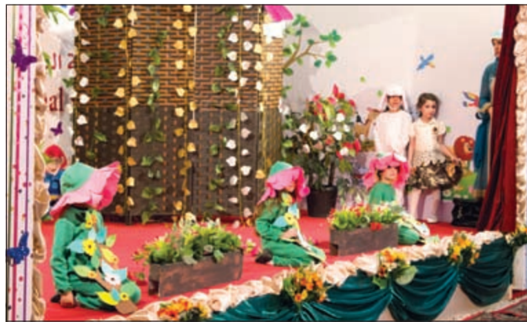
من فقرات الحفل