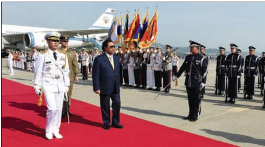
سمو الشيخ جابر المبارك مستعرضاً حرس الشرف لدى وصوله إلى سيئول

رئيس الوزراء من سيئول: تسهيلات للمستثمرين لإنجاز مشاريع الطاقة والبنية التحتية