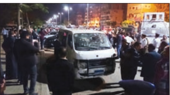
الميكروبيص الذي تعرض للهجوم الإرهابي وأسفر عن استشهاد 8 من أفراد الشرطة

القاهرة: «داعش» تبني هجوم حلوان كرد فعل على حكم «التخابر مع قطر»