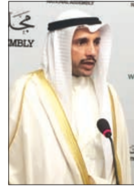
الرئيس مرزوق الغانم في مجلس الأمة أمس