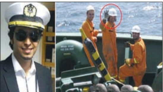
صورتان بينهما مواقع التواصل الاجتماعي مدعية أنهما لضابط (ع.ع)

«تليغراف»: ضابط بحري كويتي ينضم إلى «داعش» بعد تدريبه في بريطانيا