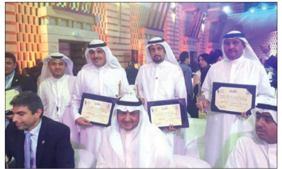
فريق تلفزيون الكويت وجوائز اتحاد الإذاعات والتلفزة العربية