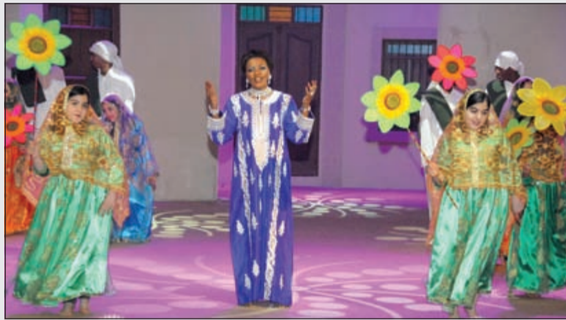
قطومة تؤدي وصلة غنائية في أحد الأوبريتات الوطنية