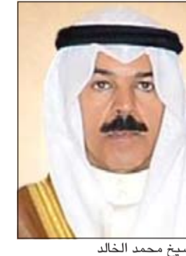
الشيخ محمد الخالد

وضبط مواطنان الاول مدين بـ 9,847 ديناراً، والثاني بـ 1,445 ديناراً. وفي محافظة الفروانية تم ضبط 9 مطلوبين جنائي ومدني ومتغيبين ومخالفين للإقامة و8 من دون إثبات. كما ضبط سوري ومصري وبدون قفصين وسيلاني مطلوبين للتنفيذ المدني. وفي محافظة مبارك الكبير تم ضبط 6 متغيبين و2 عمالة سائبة وتحريير 87 مخالفة مرورية منهم 16 مخالفة وقوف بمواقف المعاقين.