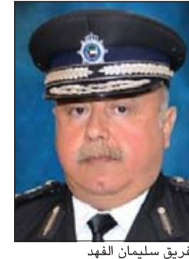
الفريق سليمان الفهد