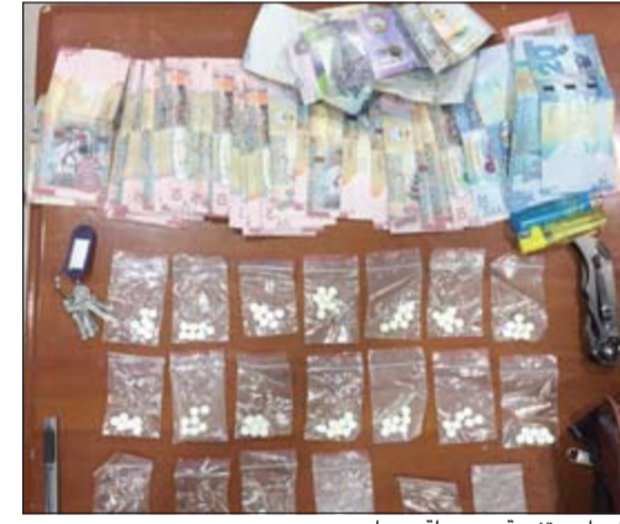
مخدرات متنوعة وحصولية بيعها