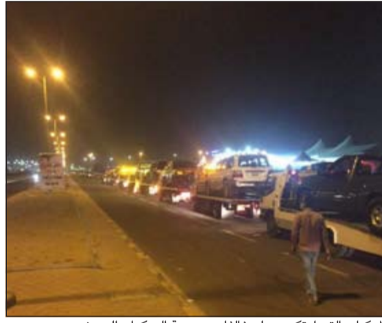
المركبات التي ارتكبت بها مخالفات جسدية الى كراج الحجز

الاحتصاص. في منطقة السالمية تمت مدهامة وكر للمقار وضبط 10 رجال و3 نساء وجميعهم من الجنسية السيلانية وورق اللعب (الجنجفة) ومبلغ 613,500 ديناراً ودفتر تسجيل قيد لعبة القمار. وفي الأحمدى تم ضبط 3 مطلوب مدني و2 مطلوب تغيب و3 مخالفين قانون الإقامة و45 من دون إثبات ومركبتين مطلوبتين وبائعيتين متجولتين وتم تحريير 104 مخالفات مرورية و8 مخالفه مواقف معاقين وحجز 28 مركبة، كما تم ضبط 3 مواطنين