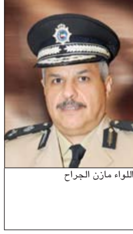
اللواء مازن الجراح

أبلغ مواطن غرفة العمليات بعد أن شاهد إحدى البنائيات التي يقطن بجانبها يرتادها الوافدات وتوجه رجال الأمن وتم ضبط الوافدات وإحالتهم الى الحجز. وقال مصدر امني ان بلاغا