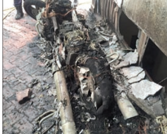
الحريق كاد يمتد إلى سرداب عمارة