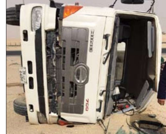
الشاحنة التي انقلبت

سيرا او حوادث مرورية. من جهة اخرى، انقذت العناية الإلهية وسرعة استجابة رجال الإطفاء سكان عمارة بمنطقة السالمية من حريق بسبب التخزين الخاطيء في سرداب العمارة. وكانت غرفة العمليات تلقت بلاغا صباح امس عن وجود