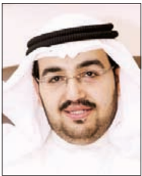
الحمامي علي الحلي

أبلغ مواطن غرفة العمليات بعد أن شاهد إحدى البنائيات التي يقطن بجانبها يرتادها الوافدات وتوجه رجال الأمن وتم ضبط الوافدات وإحالتهم الى الحجز. وقال مصدر امني ان بلاغا