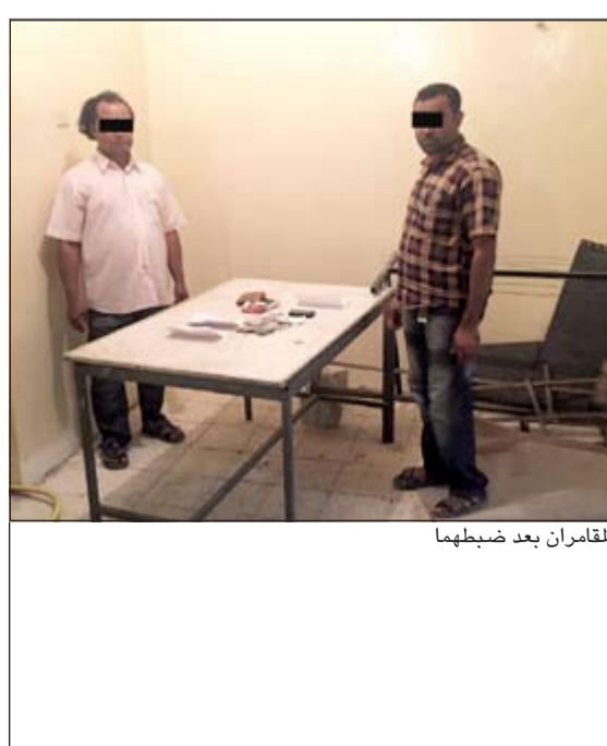
المقارن بعد ضبطهما

سيرا او حوادث مرورية. من جهة اخرى، انقذت العناية الإلهية وسرعة استجابة رجال الإطفاء سكان عمارة بمنطقة السالمية من حريق بسبب التخزين الخاطيء في سرداب العمارة. وكانت غرفة العمليات تلقت بلاغا صباح امس عن وجود