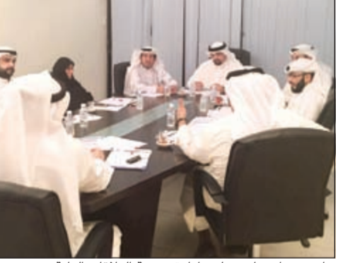
جانب من اجتماع مجلس إدارة جمعية العلاقات العامة

أكدت جمعية العلاقات العامة في بيان لها أن مجلس إدارة الجمعية في دورته الجديدة اجتمع ووضع إستراتيجية جديدة للجمعية تشمل خططا واضحة لتطوير دور العلاقات العامة في جميع الجهات الحكومية والخاصة، لافتة إلى ضرورة إعطاء هذه الهيئة ما تستحق من الاهتمام والتقدير، خاصة أنها الواجهة المشرفة لأي مؤسسة أو قطاع.