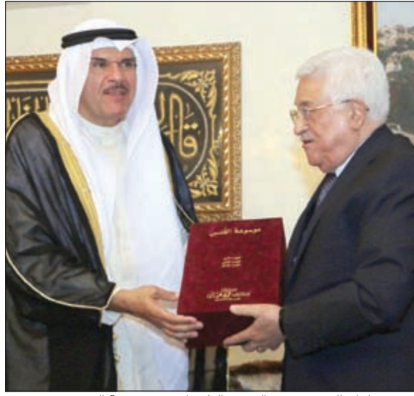
الشيخ سلمان الحمود يهدي الرئيس الفلسطيني «موسوعة القدس»