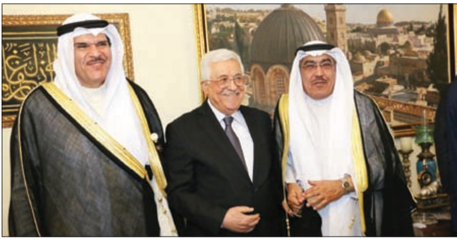
الرئيس الفلسطيني محمود عباس والشيخ سلمان الحمود والزميل عدنان الراشد