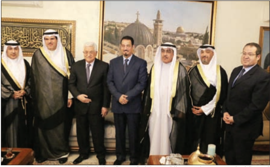
الرئيس الفلسطيني محمود عباس متوسلاً لدى الشيخ سلمان الحمود والوفد المرافق له