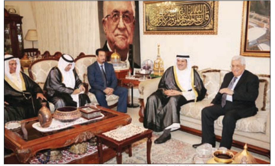
الرئيس الفلسطيني محمود عباس خلال لقائه الشيخ سلمان الحمود والوفد المرافق