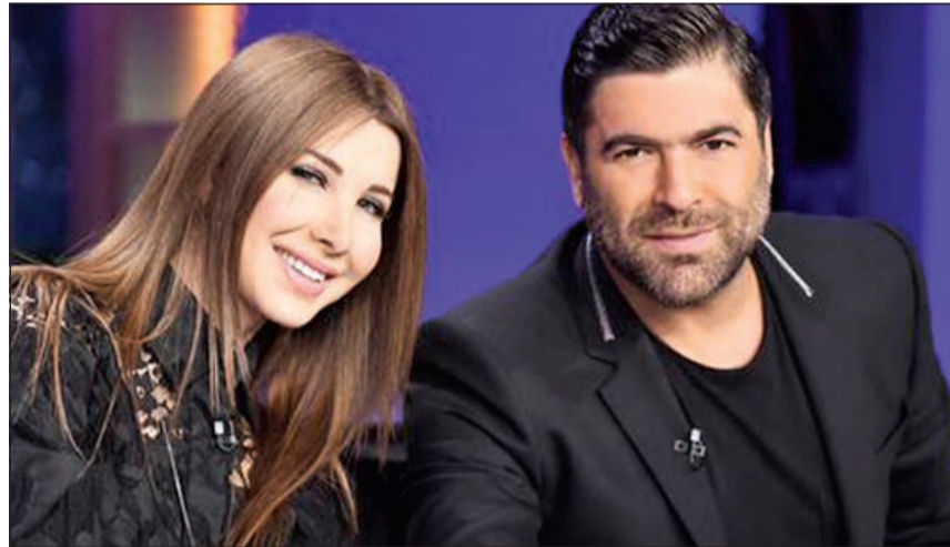
وائل كفوري ونانسي عجرم في لجنة «أراب آيدول»