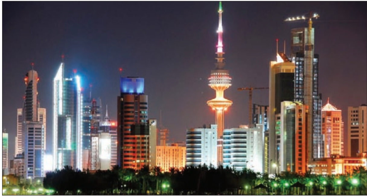
السوق العقاري يترقب تبعات ارتفاعات أسعار الكهرباء والماء

أشار تقرير بنك الكويت الدولي حول تطورات سوق العقار الكويتي خلال الربع الأول من عام 2016، إلى تراجع في مؤشرات السوق ولكل القطاعات العقارية باستثناء القطاع التجاري الذي شهد نشاطاً أفضل من ذلك المسجل في الربع السابق والربع المقابل من العام الماضي، وفي المجمل فقد تراجع مؤشر مبيعات العقار الإجمالية بنحو «10٪» مقارنة بالربع السابق، حيث بلغت قيمة المبيعات نحو «747» مليون دينار فقط (عقود ووكالات) مقارنة بنحو «828» مليون دينار خلال الربع السابق، ليسجل مستوى المبيعات تراجعاً بنسبة «22٪» على أساس سنوي، حيث بلغت قيمة مبيعات السوق خلال الربع الأول من عام 2015 نحو «956» مليون دينار، ليستمر تأثر السوق بتبعات تراجع أسعار النفط واستمرار حالة التخوف من التطورات الاقتصادية والجيوسياسية في المنطقة، الأمر الذي فرض حالة من الهدوء على سوق العقار الكويتي انتظاراً لتحسن مستقبلي في الأفق الاقتصادي على المستويين المحلي والعالمي.