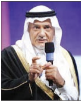
الأمير تركي الفيصل

مشتركة تربطنا معاً سواء كانت محاربة الإرهاب أو الانخراط في تحسين السلام في المنطقة