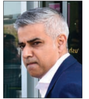
عمدة لندن الجديد صادق خان

لندن - وكالات: انتخب نائب حزب العمال المعارض في بريطانيا، صادق خان، امس، رئيساً لبلدية لندن بعدما هزم مرشح حزب المحافظين الحاكم زاك جولد سميث، ليصبح بذلك أول مسلم يتولى منصب عمدة عاصمة أوروبية. وولد خان «45 عاماً» في لندن، وهو نجل مهاجر باكستاني كان يعمل سائق حافلة. وعمل عمدة لندن الجديد في بدايته محامياً في مجال حقوق الإنسان قبل أن يشغل منصب وزير الدولة للشؤون المحلية في حكومة رئيس الوزراء السابق غوردون براون عام 2008.