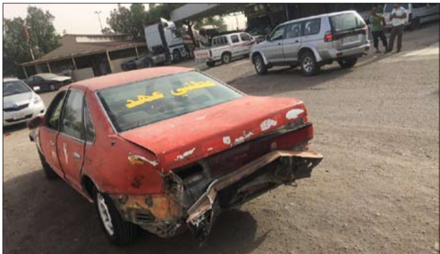
سيارة متهاكة ومع ذلك تستخدم في الاستهتار والرعوثة

أثناء تجوال دورية لأمن الاحمدي في منطقة المنقف، تمت مشاهدة بتغالي متوقف خلف المركبات ومعه اكياس سوداء، وحين مشاهدته الدورية لاذ بالفرار، فتمت ملاحقته وضبطه، وبالتأكد من الاكياس تبين ان بها مواد مسكرة محلية (عدد 20 بطلا)، وعليه تمت احالته لجهة الاختصاص.