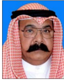
اللواء محمود الطباخ

انتهت قضية سلب وادف هندي يعمل سائق جوال إلى ضبط وأدين نيابيين امتهنا سلب الوافدين الأسويين خاصة سائقي التاكسي الجواله بأسلوب وحيد وهو الصعود إلى التاكسي ومن ثم إشهار أسلحة بيضاء وتهديد السائقين بالقتل وسلب ما بحوزتهم من مبالغ مالية، وبحسب مصدر أممي فإن وادفا هندي يعمل سائق تاكسي جوال تقدم إلى مخفر أبوخليفة قائلًا أنه كان