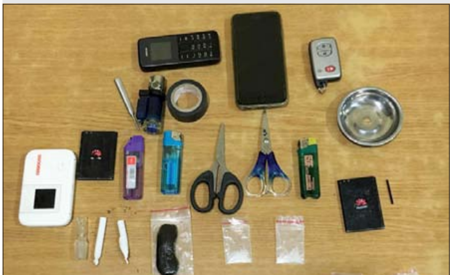
حجوب واكياس شبو