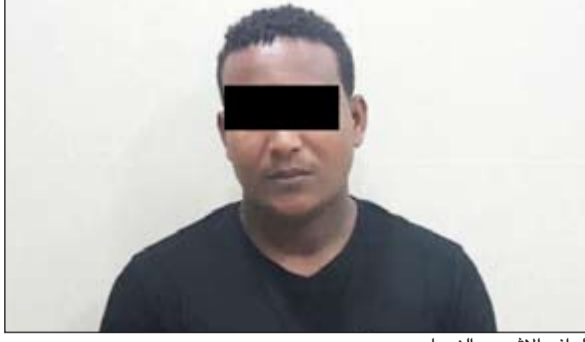
الوافد الإثيوبي النصاب

عن استعداده لتزويد الأسر بعمالة إثيوبية بسعر 400 دينار فقط، وأنهم تعرضوا للنصب. وقال المصدر: إن مثل هذه النوعية من القضايا تحظى باهتمام من قبل وكيل وزارة الداخلية المساعد لشؤون الأمن الجنائي اللواء عبدالحميد العوضي. وأضاف المصدر: تم عمل التحريات والتي انتهت بتحديد