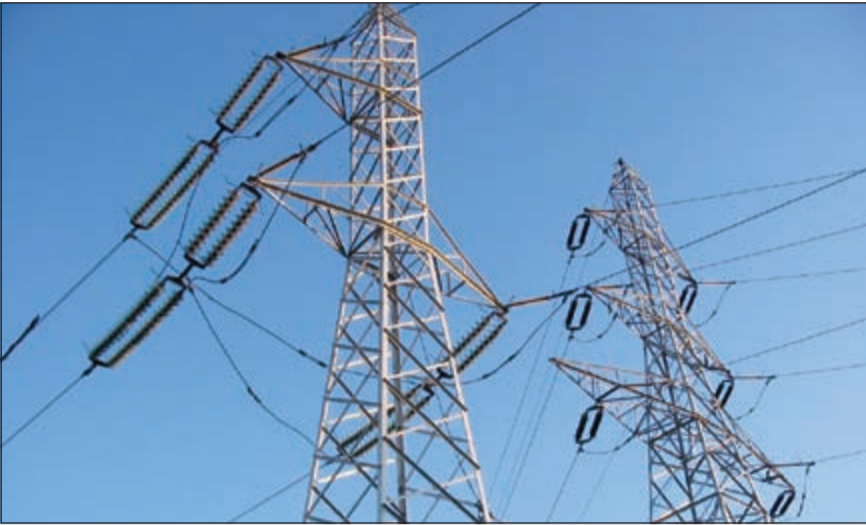
معدلات استهلاك الكهرباء في الدول العربية تشهد تزايداً مستمراً نتيجة لعملية التوسع العمراني

كونا: قالت منظمة الاقطار العربية المصدرة للبتترول (أوبك) ان التكلفة الإجمالية لمشاريع الربط الكهربائي العربي التي اتفقت على مدى العقدين الماضيين بلغت نحو 2 مليار دولار.