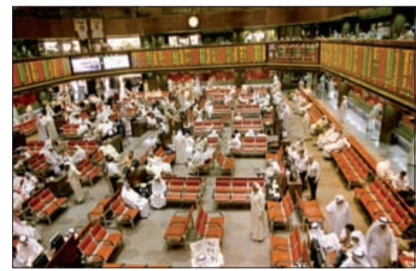
البرصة شهدت نشاطاً كبيراً في تغيير الملكيات المعلنة للشركات المدرجة

قال تقرير صادر عن مركز الجمان ان حركات الملكيات المعلنة في قوائم الشركات المدرجة قفزت من 12 حركة خلال الأسبوع قبل الماضي المنتهي في 2016/4/21 إلى 28 حركة خلال الأسبوع الماضي المنتهي في 2016/4/28، وذلك على خلفية إعادة هيكلة شريحة عريضة من الملكيات المعلنة لـ «كتلة الاستثمارات الوطنية»، التي تقودها «مجموعة الخرافي»، والتي بلغ عدد حركاتها 22 شركة وذلك بواقع 7 حركات للرفع و6 حركات للخفض، وابتداء 6 حركات للدخول في قوائم كبار الملك و9 للخروج منها.