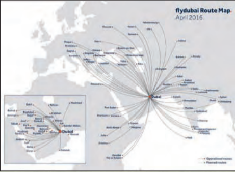
شبكة المدن التي تخدمها «فلاي دبي» والمكونة من 90 مدينة في 43 دولة