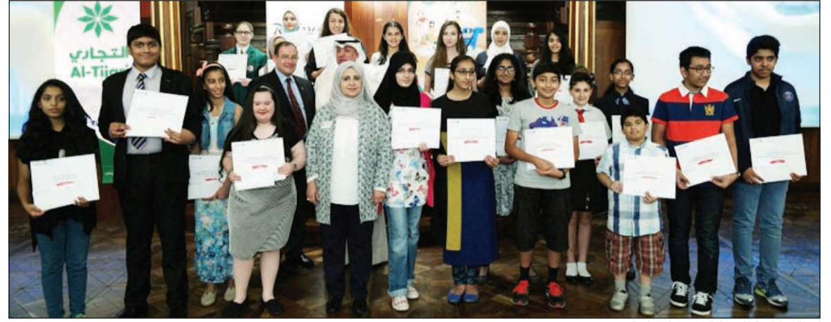
لقطة تذكارية للمشاركين في المسابقة

هذا الحساب هو الطريقة المختارة لاختبار أفضل 25 لوحة للفوز في المسابقة ليحصل كل فائز على جائزة نقدية قدرها 50 ديناراً، وتم الإعلان خلال الحفل الكبير الذي أقيم بقاعة عبدالحسين معرفي بفندق راديسون بلو عن الفائزين أصحاب المواهب المميزة والتي حازت لوحاتهم على أفضل التقييمات من قبل لجنة التحكيم التي قامت بتقييم اللوحات. ومعروف أن حسابي الأول هو حساب توفير مصمم خصيصاً للأطفال حتى 14 سنة، ويعد