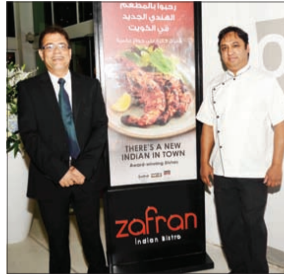
مطعم زافران الوجهة المفضلة للذائقة