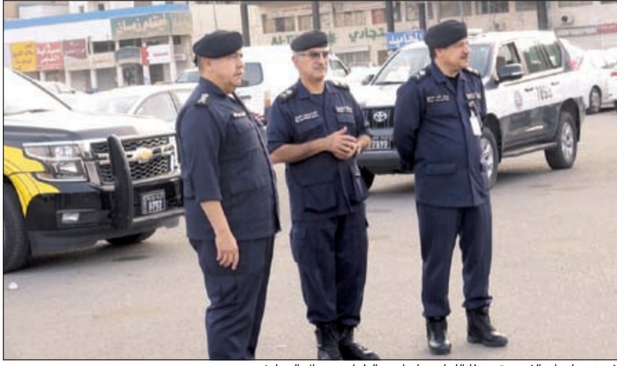
الفريق سليمان الفهد متوسطا اللواءين إبراهيم الطراح وجمال الصايغ