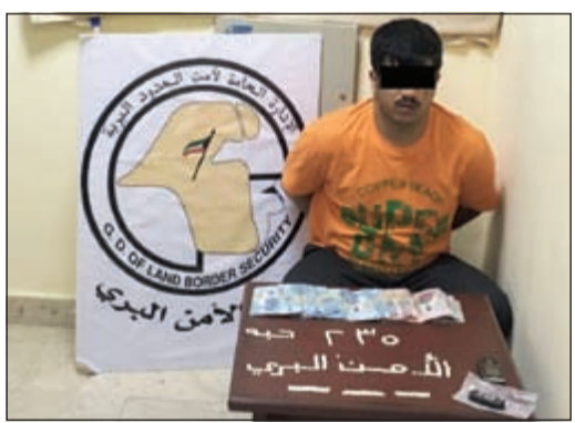
المتم وأمامه الحبوب وحصيلة البيع