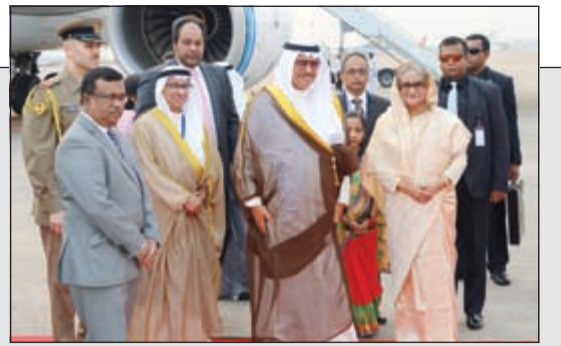
سمو رئيس الوزراء الشيخ جابر المبارك وفي استقباله رئيس وزراء بنغلاديش شيمتة حسينة واجد

المبارك وصل بنغلاديش ضمن جولة أسيوية: أحمل رسائل من الأمير تستهدف تعزيز العلاقات المتينة وسبل تطويرها 06