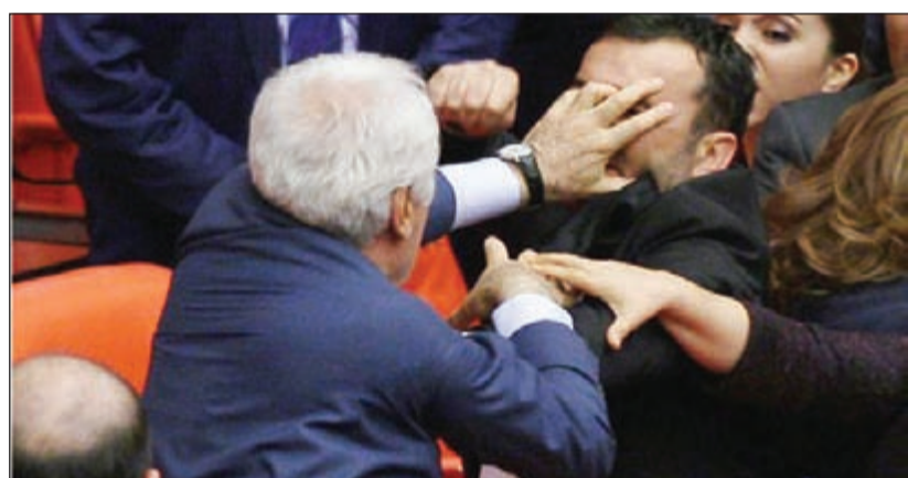
جانب من الشجار في البرلمان التركي أمس الاول

«رفع الحصانة» بـ «اللزمات وقوارير المياه»