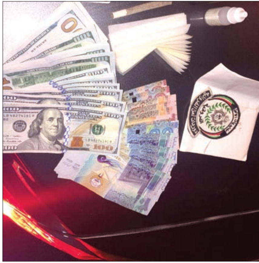
مواد مخدرة ونقود متحصلات بيع

محلية الصنع. وفي محافظة الجوهراء، تم ضبط مواطن مطلوب القاء قبض وتمت إحالته إلى جهة الاختصاص. وآخر بحوزته مواد مخدرة (كيميكال)، وثالث برفقة خليجي وبحوزتهما مواد مخدرة (شبو)، كما تم ضبط 6 مركبات مسروقة، وسلم مواطن ابنه بحوزته كيس بداخله مادة عشبية اللون يشتبه في أنها مواد مخدرة (كيميكال)، وتم ضبط مواطن مطلوب بمبلغ 1845 د.ك. وفي محافظة الفروانية