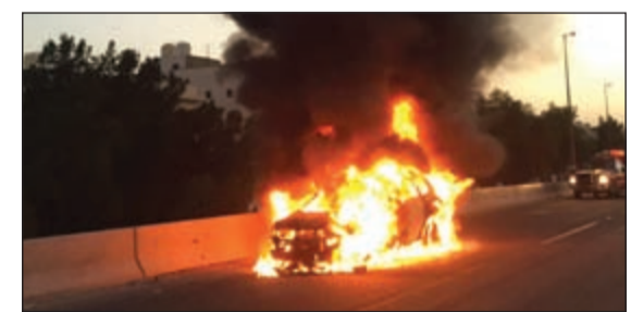
النار اتت على المركبة تماما

الشمري إلى مكان الحادث وتم إنقاذ الناقة المحشورة. كما سيطر رجال إطفاء مركز الجلييب على حريق وسيارة وتم السيطرة على حريق المحول بعد فصل التيار الكهربائي.