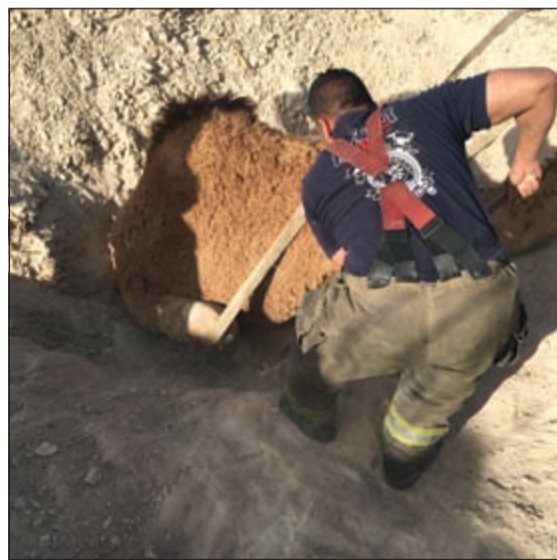
أحد رجال الإطفاء خلال عملية إنقاذ الناقة