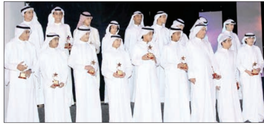
عدد من اللاعبين المكرمين

يولي الرياضة والرياضيين كل اهتمامه. وأضاف أن الهيئة العامة للرياضة تحرص على تقديم الدعم لمختلف الألعاب الرياضية وإبطالها وتوفير كل الإمكانيات لإبراز المواهب والعناصر الصاعدة وأنه يأمل في تحقيق امنية الشباب الرياضة للعودة إلى البطولات الدولية والقارية