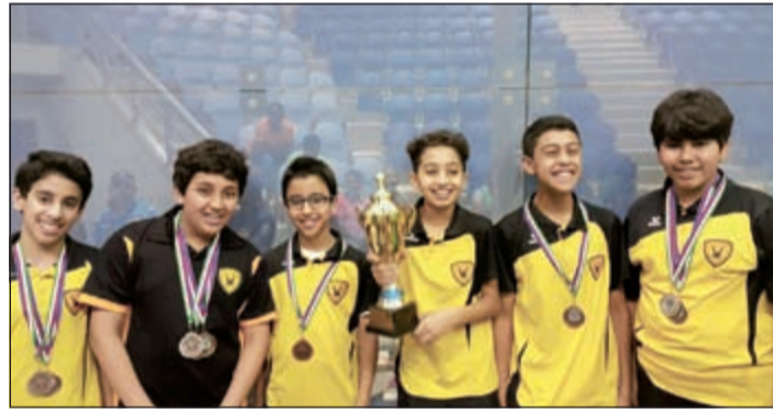
فئة اللاعبين بالوقوف على منصة التتويج