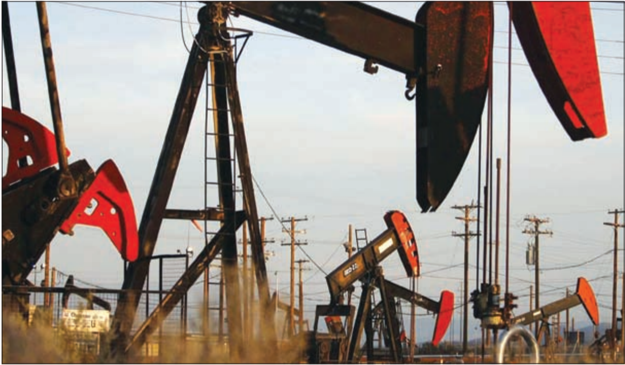
توقع العديد من التقارير أن تشهد أسعار النفط انهيارا كبيرا خلال السنوات القليلة المقبلة بسبب التغيرات التي تشهدها الأسواق العالمية والتي يتوقع أن تؤدي إلى انحسار الطلب على الوقود التقليدي، فيما يقول تقرير لوكالة «بلومبيرغ» إن الانهيار القادم «لا تعافي بعده».

وتأتي هذه التوقعات بعد أن أعلنت السعودية «رؤية 2030» التي تهدف للاستعداد إلى الدخول في عصر «ما بعد النفط»، وهو ما يعني أن السعودية التي تترعب على عرش أكبر منتجي النفط في الكون تخبث قبل غيرها إلى أن طفرة الأسعار المرتفعة للخام لن تستمر طويلا، وأن انهيار أسواق النفط قد يكون قريبا، وبدأت إجراءات التحول من الاعتماد على النفط إلى تنويع الاقتصاد وتنويع مصادر إيراداته.