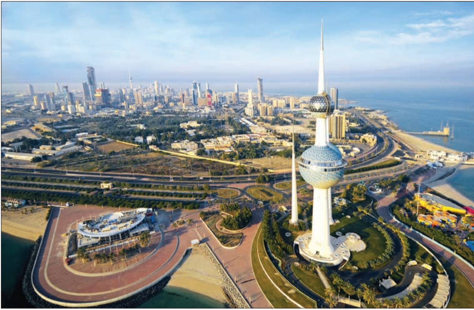
الكويت ما زالت تدرس تخفيضات في الدعم على الوقود في محاولة منها للحد من العجز المتوقع في الميزانية الناتج عن انخفاض النفط

ورغم ذلك فإن الحكومة ربما سوف تتحرك بحذر وبشكل تدريجي من أجل تطبيق الإصلاحات في أعقاب انتهاء إضراب عمال النفط.