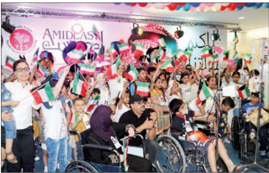
الأطفال أثناء الحفل

أعلنت زين الشركة الرائدة في تقديم خدمات الاتصالات المتنقلة في الكويت رعايتها للحفل الترفيهي الخيري الذي أقامه برنامج بعثة التبادل الثقافي من الولايات المتحدة بمرکز «أمديست» (برنامج Yes) لأطفال مرضى السرطان واللوكيميا وعائلاتهم في مستشفى بنسك الكويت الوطني.