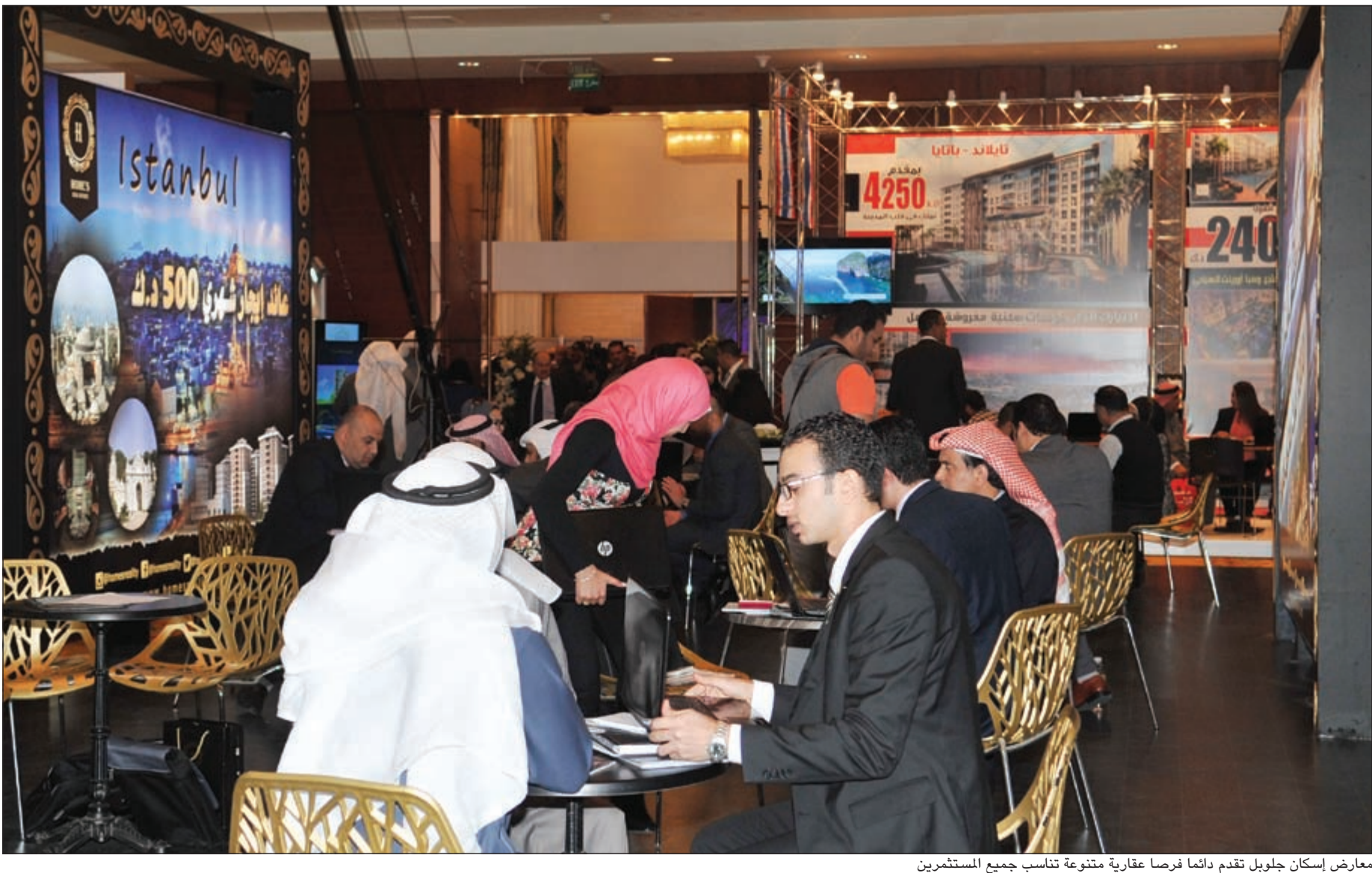
معارض إسكان جوليب تقدم دائماً فرصاً عقارية متنوعة تناسب جميع المستثمرين

وعن مشروعات الشركة التي سيتم طرحها خلال المعرض، قال مهاب: سنطرح شاليهات إسكان جوليب - وشاليهات الخيران، والقصر الأبيض - شرم الشيخ - جمهورية مصر العربية، وكيموند (لو-ديفانس) مدينة الشيخ زايد - محافظة القاهرة.