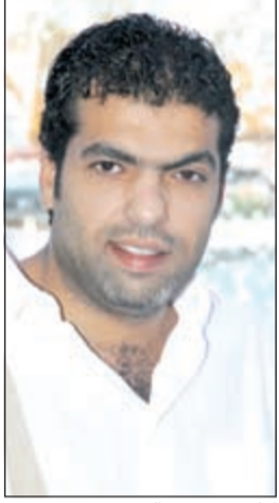
المحن مشعل العروج