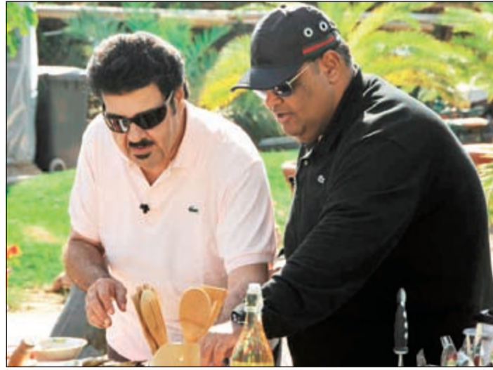
.. ومع بلبل الخليج نبيل شعيل