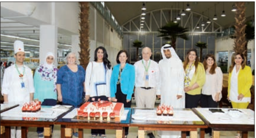
السفيرة الكندية تتوسط الحضور