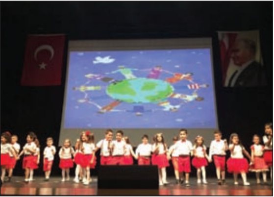
عدد من الأطفال المشاركين في الحفل