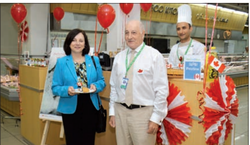
جولة على المنتجات الكندية