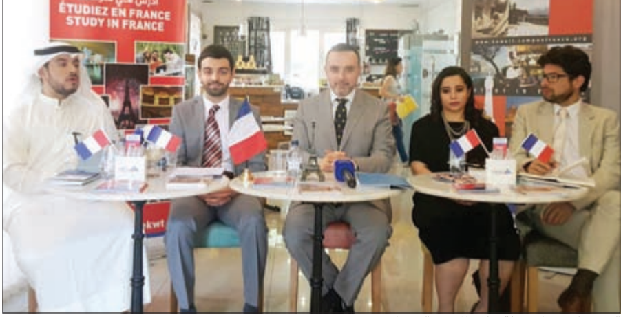
السفير كرسيتيان نخلة خلال المؤتمر الصحفي

يبدلون كل الجهود بهدف حث الطلاب الكويتي على الاستفادة من الخدمات التعليمية التي تقدمها الجامعات الفرنسية حيث يتساوى مع الطالب المحلي في جميع الاختصاصات سواء الهندسة أو الأدب أو الحقوق والتجارة ودراسة القانون وغيرها.