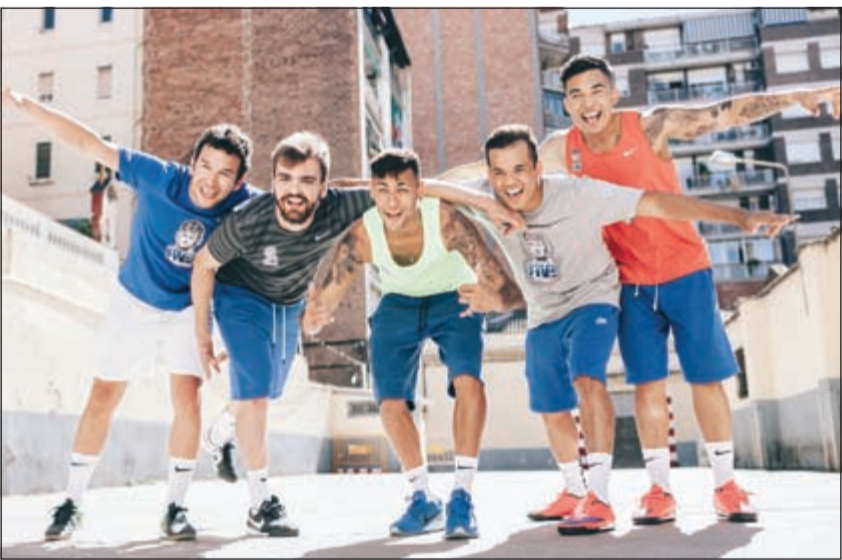
نجم برشلونة والبرازيل نيمار مع عدد من المشاركين

إضافية وهي فرصة مقابلة نيمار جونيور وحضور مباراة برشلونة على مقاعد كبار الشخصيات في ملعب الكامب نو. سجل فريقك المكس من 5-7 أشخاص الآن على موقع www.neymarjrsfive.com لفرصة لتمثيل الكويت في النهائي في البرازيل ومقابلة نيمار.