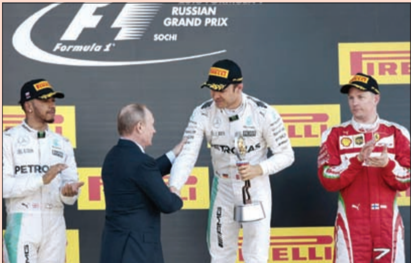
الألماني نيكو روزبرغ يتسلم الكأس من الرئيس الروسي فلاديمير بوتين

واصل سائق مرسيدس الألماني نيكو روزبرغ تحليقه في سمانه الخاصة بعد فوزه بجائزة روسيا الكبرى، المرحلة الرابعة من بطولة العالم لسباقات فورمولا 1 أمس على حلبة سوتشي.