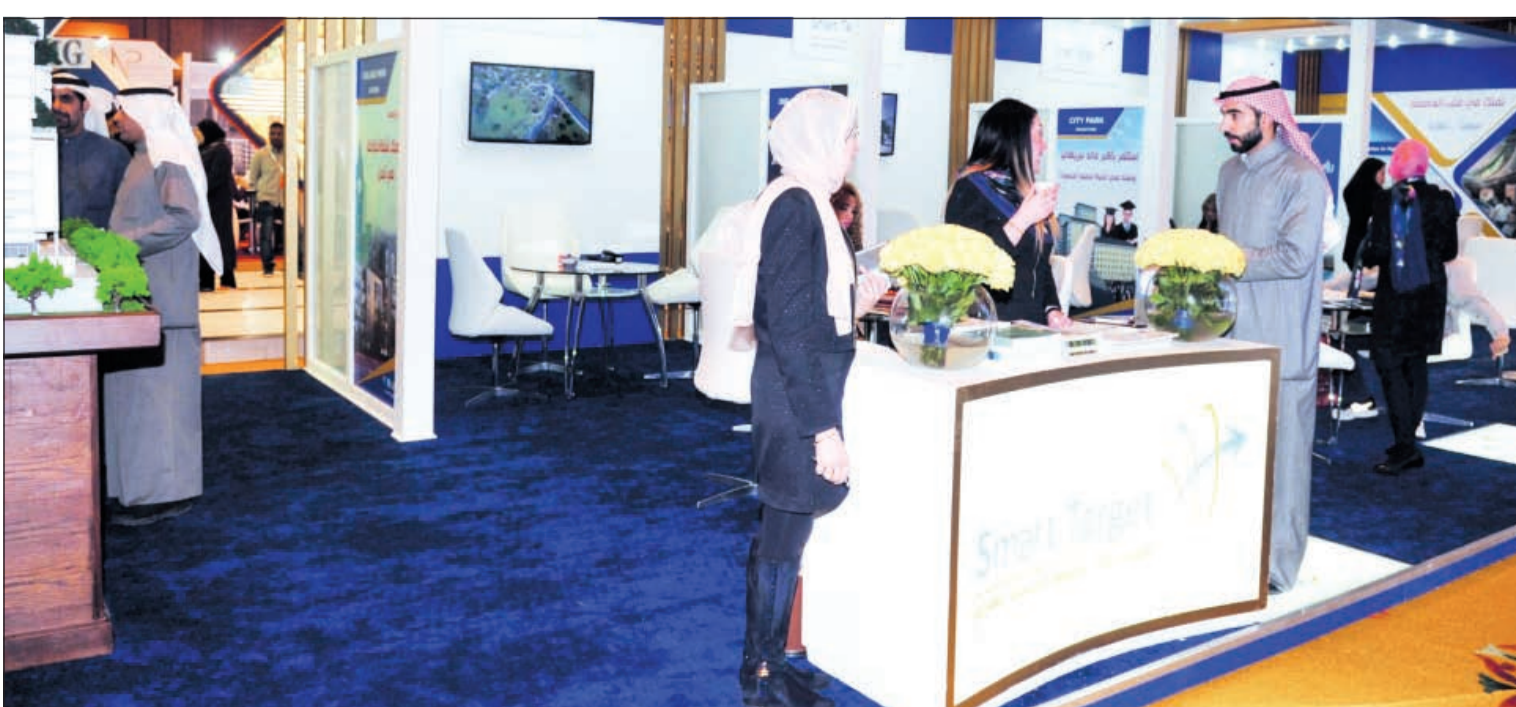
إقبال جماهيري على معارض إسكان جلوبل العقارية