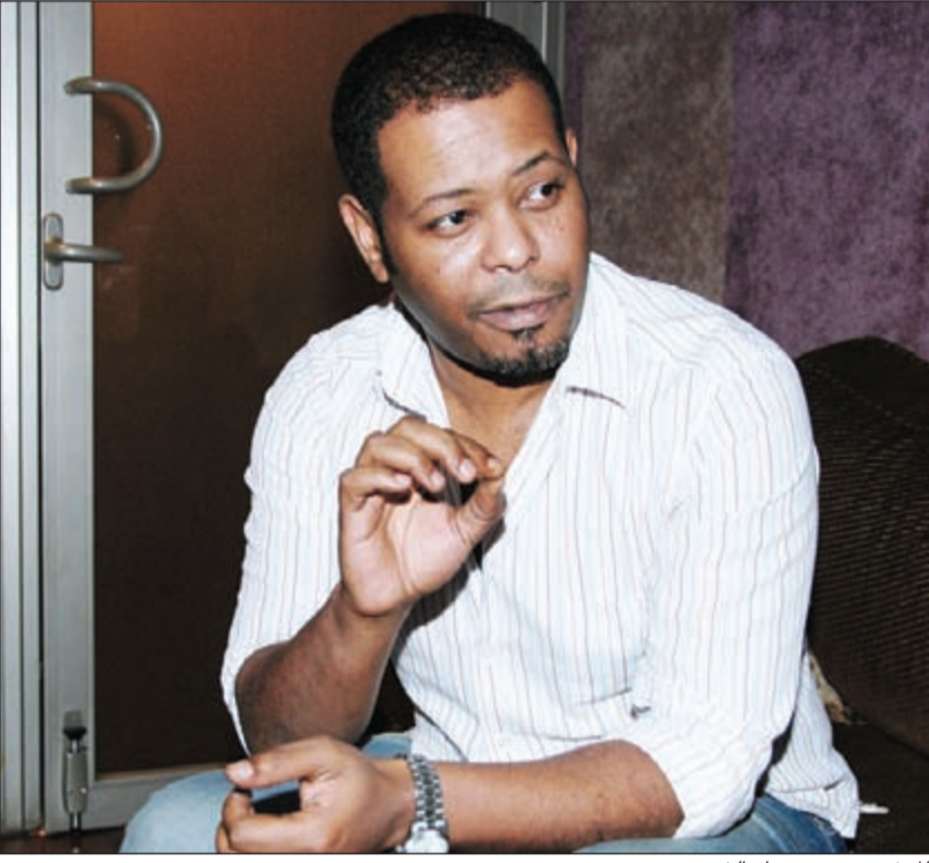
المخرج محمد دحام الشمري

تتقدم «فنون الأنباء» بأحر التعازي والمواساة إلى المخرج محمد دحام الشمري لوفاة والده، سائلين المولى عز وجل أن يتغمد الفقيد