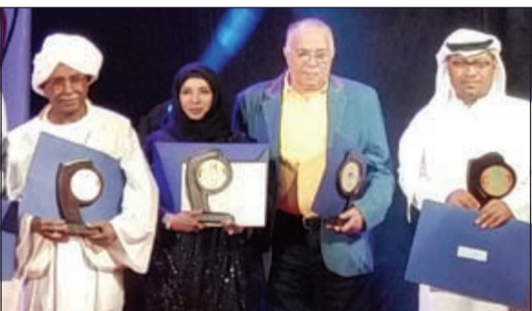
عائشة عبدالرحمن مع عدد من المكرمين

كرمت اللجنة المنظمة لمهرجان المسرح العربي بالقاهرة الفنانة الإماراتية عائشة عبدالرحمن في حفل ختام المهرجان، الذي أقيم تحت رعاية وحضور وزير الثقافة حلمي النمنم ورئيس المهرجان المخرج خالد جلال ومدير المهرجان د. عمرو دودة، وذلك كشخصية فنية من دولة الإمارات العربية المتحدة الشقيقة أثرت الحركة المسرحية العربية. وعبرت الفنانة الإماراتية عائشة عبدالرحمن عن سعادتها لهذا التكريم قائلة: كم أنا سعيدة وفخورة أن أمثل