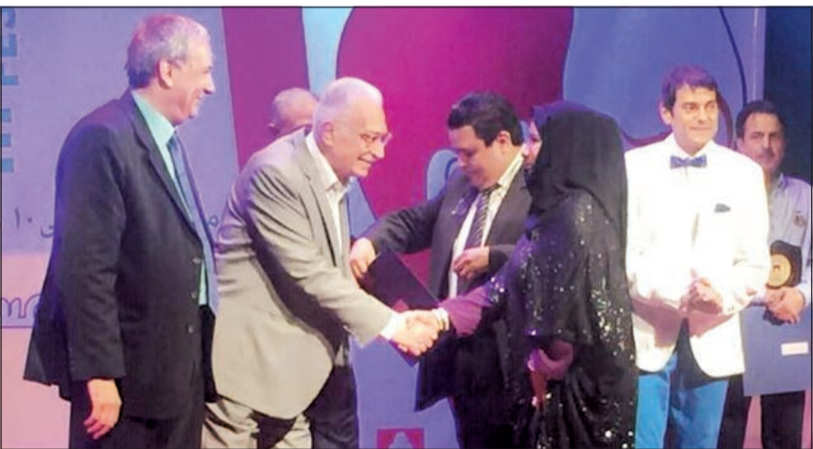
وزير الثقافة المصري حلمي النمنم مكرما الفنانة الإماراتية عائشة عبدالرحمن

فخر أفرح به من بلد العطاء الفني مصر الشقيقة.