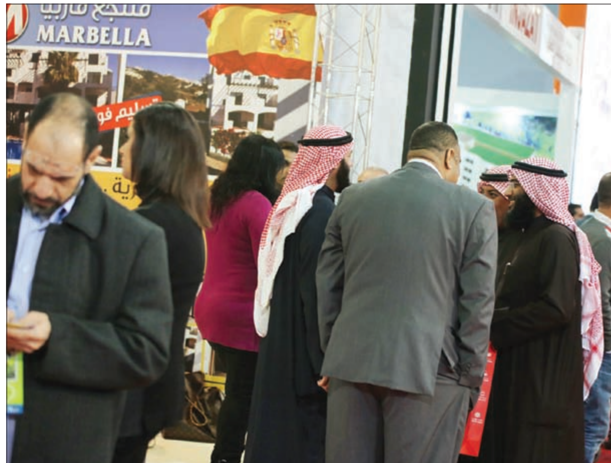
جانب من أحد معارض النخبة