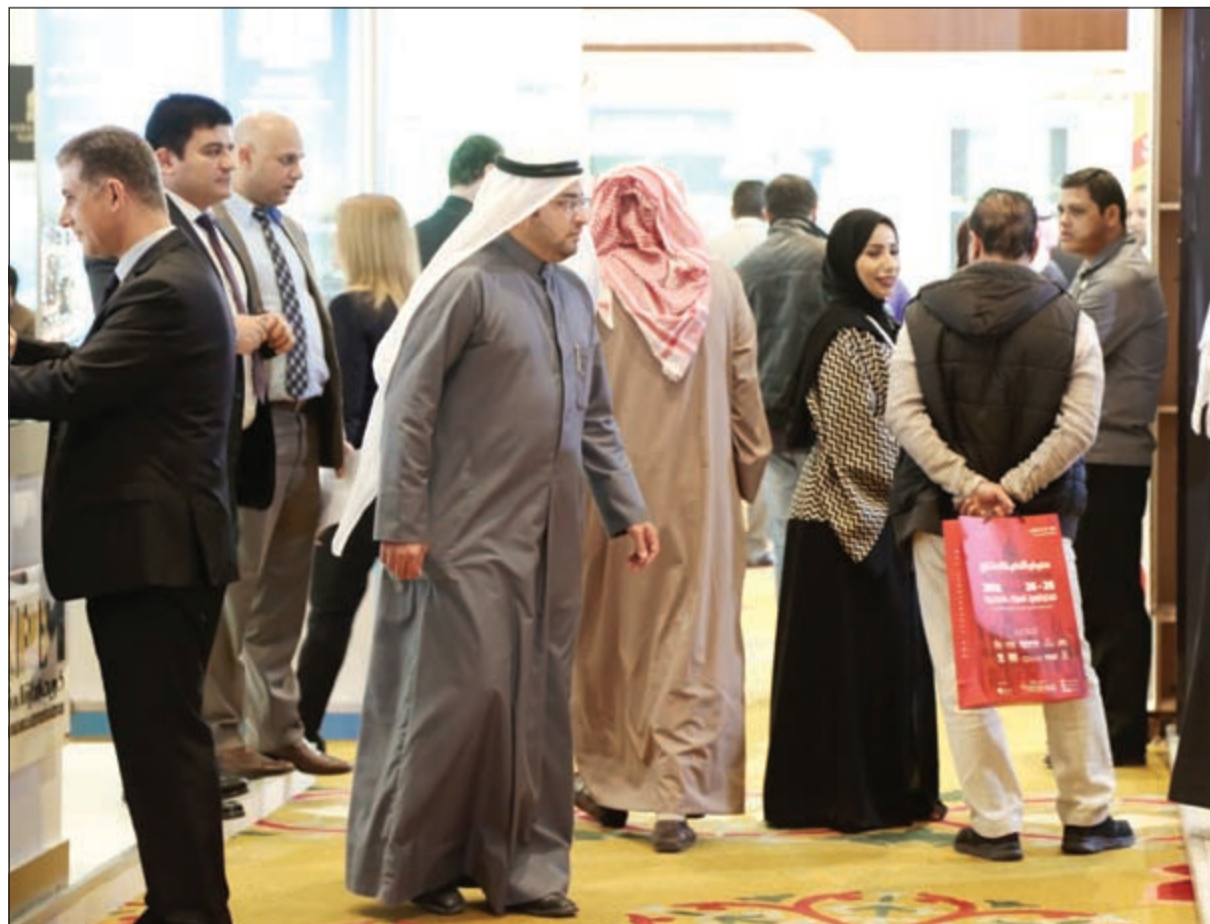
أقبال جماهيري كبير على معارض إسكان جولبل العقارية

وقال المقبالي: تطرح شركتنا على جمهور زوارنا الكرام مشاريع متنوعة في سلطنة عمان وبالتحديد في ولاية صحران، وولاية صحران وبها مناطق سياحية وأثرية،