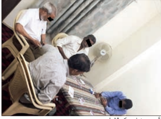
الأسويبيون في وكر القمار