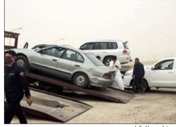
حجز إحدى المركبات

والجنوبية بالإضافة إلى رصد المخالفات المتنوعة. وأضاف أن الحملة المرورية أسفرت عن تسجيل 5071 مخالفة مرورية متنوعة، كما تم حجز 337 مركبة، فيما تم