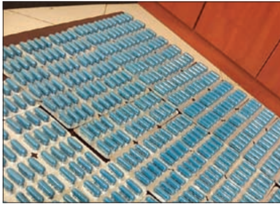
الترامادول المضبوط في المطار