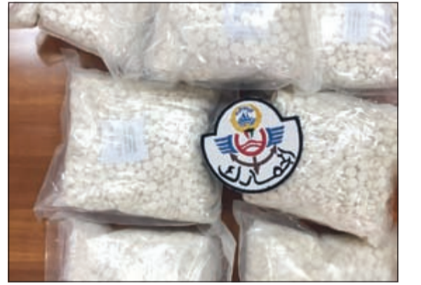
الجبوب المخدرة التي تم ضبطها