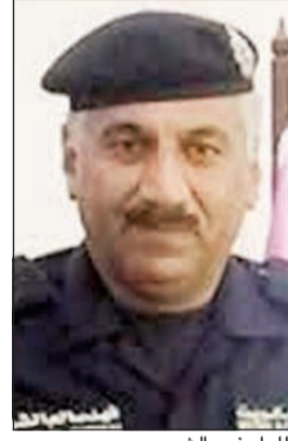
اللواء فهد الشويخ

نفذت الإدارة العامة للمرور وبتوجيهات مباشرة من الوكيل المساعد لشؤون المرور اللواء عبدالله المهنا وإشراف ومتابعة مساعد مدير عام الإدارة العامة للمرور لشؤون تنظيم السير والتراخيص اللواء فهد الشويخ حملة مرورية في مختلف المحافظات الست بمشاركة دوريات الطرق السريعة والرقابة الأمنية (مباحث المرور) بهدف حماية وتأمين سلامة مستخدمي الطريق والعمل على تطبيق القانون للحد من المخالفات المرورية والسلوكيات الخاطئة. وقال مساعد مدير عام الإدارة العامة للمرور لشؤون تنظيم السير والتراخيص