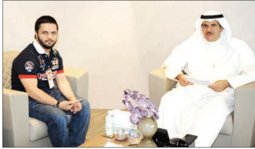
الشيخ سلمان الحمود مستقبلاً سالم القطان

للدعم المميز الذي يقدمه الشيخ سلمان والوزارة لجميع الاندية والجمعيات والفرق الكويتية التي ترعى المعاقين بما يساهم في دمجهم مجتمعياً.