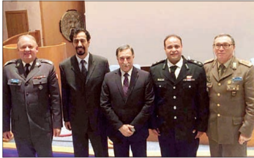
السفير الشيخ علي الخالد يتوسط الجنرال يانوش بويارسكي ونائب وزيرة الدفاع الإيطالية دومينيك روسي

تقديره لمستوى التعاون المتنامي بين كلية دفاع (ناتو) والكويت في اطار مبادرة اسطنبول للتعاون والحوار المتوسطي، مشيدين بجمعهم من من المتسابقين الكويتيين في السدورات التدريبية المتعاقبة. وتشكل الدورات الدراسية للتعاون الاقليمي اهم مبادرات حلف (ناتو) الأكاديمية مع البلدان المنخرطة في «الحوار المتوسطي» ومبادرة تعاون إسطنبول، ومن خلال التعاون المشترك مع الدول في الشرق الأوسط المنبثقة عن قمة «ريغا» في 2006، وقرارها بتعزيز حوار أوثق وتعاون مكثف في مجال التعليم.