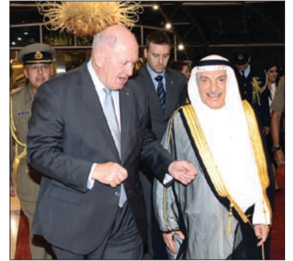
الاستشار محمد أبو الحسن مستقبلاً حاكم عام أستراليا الجنرال بيتر كوسغروف

وصل إلى البلاد مساء أول من أمس الجنرال بيتر كوسغروف حاكم عام أستراليا والوفد الرسمي المرافق له في زيارة رسمية للبلاد تستغرق أربعة أيام يجري خلالها مباحثات رسمية مع صاحب السمو الأمير الشيخ صباح الأحمد. وكان في استقباله رئيس بعثة السفير نجيب البدر مرافقة المستشار بالديوان الأميري محمد أبو الحسن.