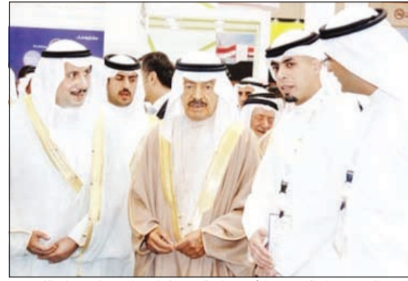
السفير الشيخ عزام الصباح والأمير خليفة بن سلمان خلال زيارة جناح الكويت

المثامة - كونا: ثمن عميد السلك الدبلوماسي سفيرنا لدى مملكة البحرين الشيخ عزام الصباح إشادة رئيس وزراء مملكة البحرين الأمير خليفة بن سلمان آل خليفة بالريادة التنموية للقطاع الخاص الكويتي في البحرين. وقال في تصريح صحفي بمناسبة حضوره افتتاح «معرض الخليج للعقار 2016»، بمشاركة من القطاع الخاص الكويتي: إن المشاركة الكويتية في المعرض التي تميزت بمشاريع جديدة ومبتكرة تعكس مدى فاعلية وتجدد هذا القطاع. وكان المعرض الذي افتتحه رئيس الوزراء البحريني الأمير خليفة بن سلمان آل خليفة يمثل منصة للشركات العقارية في المنطقة لعرض مشروعات التطوير العقاري وتوفير فرصة للباحثين عن مشروعات عقارية في البحرين والمنطقة.