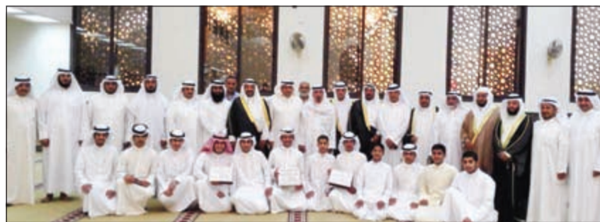
تكريم الفائزين في المسابقة

أن مبرة العوازم الخيرية منذ إنشائها عملت على نشر رسالة البر والعمل الخيري متعاونة في تحقيق ذلك مع الجهات المعنية في الكويت، خصوصاً وزارة الشؤون الاجتماعية، مشيراً إلى أن المبرة أخذت على عاتقها تكرار مسابقة القرآن الكريم بصفة سنوية وتطويرها وجعلها من المشاريع الثابتة مصداقاً لقوله تعالى (إن هذا القرآن يهدي للتي هي أقوم)، ففي كتاب الله منهج حياة وصلاح للدين والدنيا. وأضاف الكليب أن التناقص بين المتسابقين يبعث على الفخر والاعتزاز، وأن النتائج التي حصلوا عليها تنشر بجبل شاب حافظ لكتاب الله نافع لدينه ووطنه وأهله.