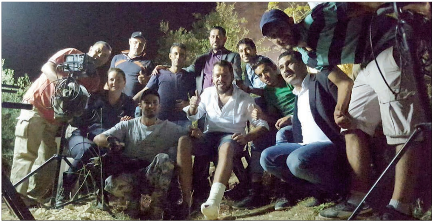
رياضة بعد علاج قدمه مع فريق عمل المسلسل

«ومملكة يوسف المغربي» تأليف حمدي يوسف، وإخراج عادل الأعصر، ومن إنتاج مدينة الإنتاج الإعلامي، وبطولة منذر رياحنة، مصطفى فهمي، علا غانم، إيناس النجار، أحمد سلامة، هالة صدقي، عبدالرحمن أبو زهرة، محمود الجندي، أنوشكا، سحر رامي، عصام شاهين، فاروق فلوكس وغيرهم.