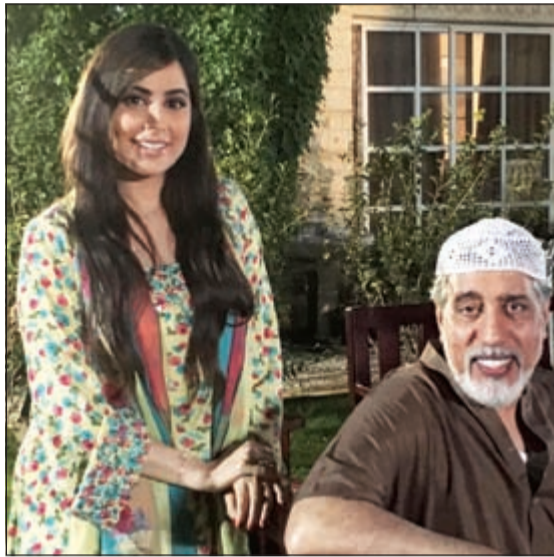
رؤى مع المنتج والفنان أحمد الجسمي