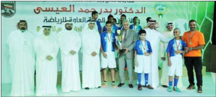
وزير التربية ووزير التعليم العالي د.بدر العيسى يكرم اللاعبين

للرياضة والوكيل المساعد للشؤون الإدارية والمالية يوسف النجار والوكيل المساعد للتنمية التربوية فيصل مقصيد وحامد الهزيم مدير إدارة الرياضة للمجمع بالهيئة العامة للرياضة وكبار مسؤولي وزارة التربية والهيئة العامة للرياضة. وأعرب العيسى عن سعادته بالمستوى الطيب للبطولة مشيدا بالتعاون الرائع والشراكة مع الهيئة العامة للرياضة والتي ساهمت بشكل كبير في منح دفعة قوية للرياضة المدرسية. وقدم خالص الشكر لوزير الإعلام ووزير الدولة لشؤون الشباب الشيخ سلمان الحمود ومدير عام الهيئة العامة للرياضة الشيخ أحمد المنصور على اهتمامهما بدعم التعاون مع وزارة التربية في الأنشطة ولاسيما الرياضة.