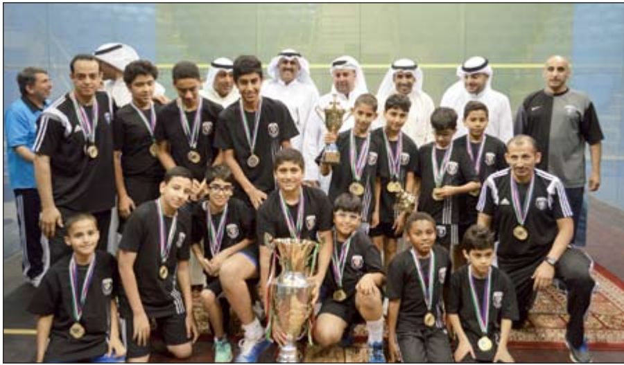
القرين بطل كأس التفوق العام مع مجلس إدارة اتحاد الإسكواش